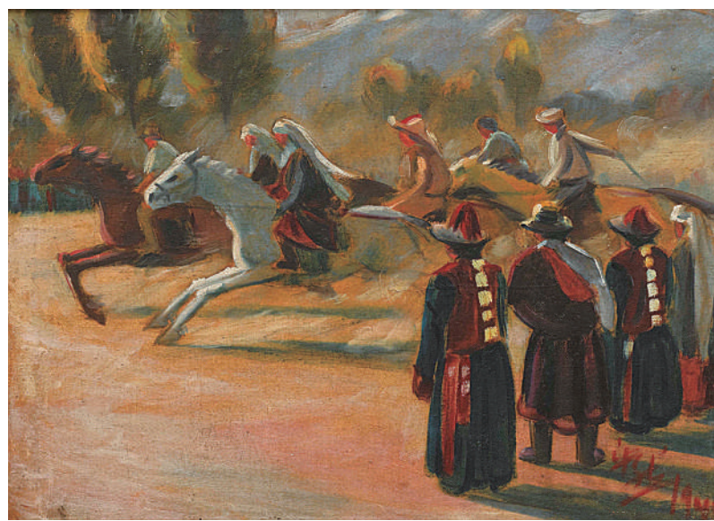
赛马(河西走廊) 韩乐然(中国) 作