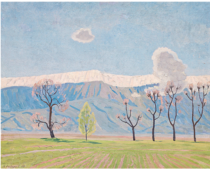
春天在山上 瓦连金·西多罗夫(俄罗斯) 作

此次展览特设互动展区，分“动感丝路”“丝路之境”“丝路寄语”三个场景。通过与京东方艺云合作，开发和运用全新数字化技术对部分艺术精品进行二次创作，以BOE画屏、105吋百变屏、数字标牌、墨水屏等新型显示技术及数字多媒体技术，实现“艺术+科技”展陈理念，让观众“身临其境”，沉浸在美妙画作中，体验科技与艺术带来的视觉冲击力。此外，展览还特别推出“创作背后的故事”篇章，用视频和文字的形式呈现各国艺术家在中国采风创作期间的心得体会，讲述中国美术馆国际艺术品馆藏中的生动故事，分享艺术家们在中国这片文化热土上的收获与感动。