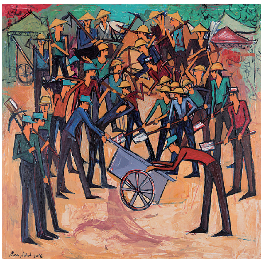
摩登舞台 阿拉·阿瓦德(埃及) 作