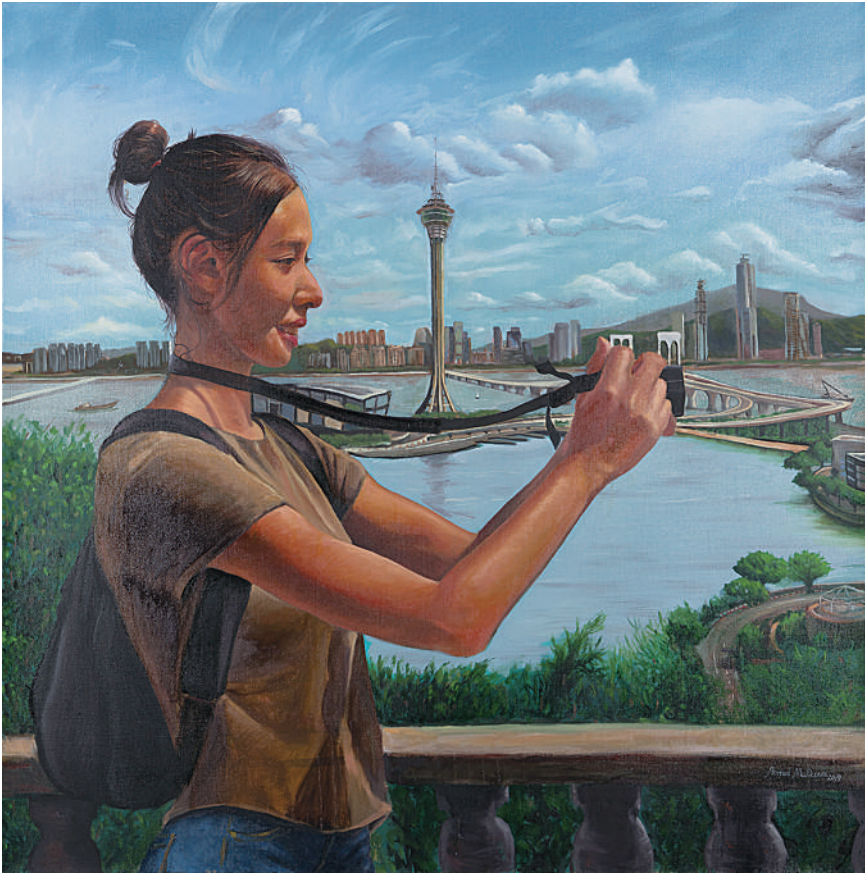
澳门风景 艾哈迈德·穆盖姆(科威特) 作