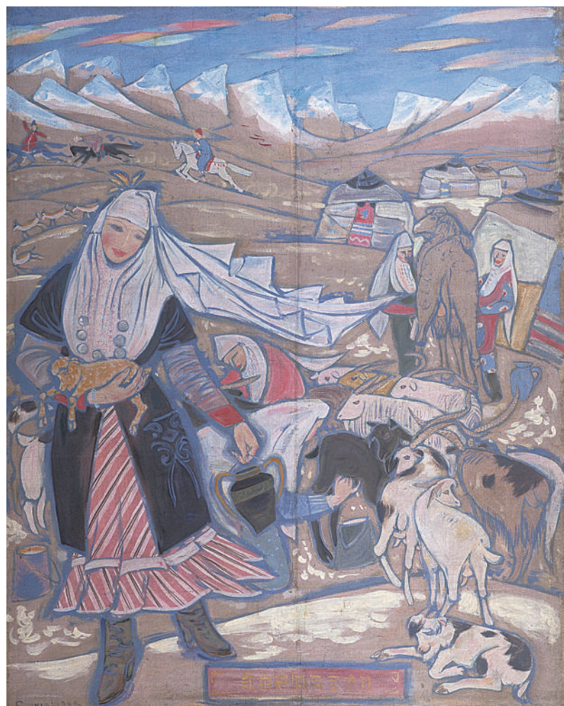
哈萨克牧羊女 董希文(中国) 作