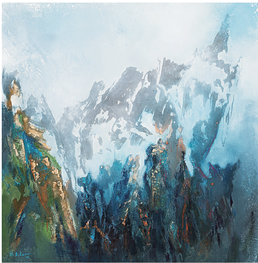
黄山 尼扎尔·达赫尔(黎巴嫩) 作