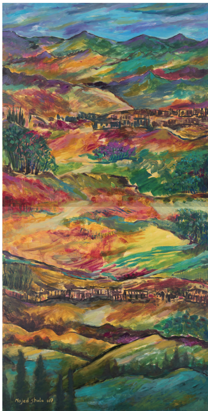
甘南风光 马吉德·沙拉(巴基斯坦) 作