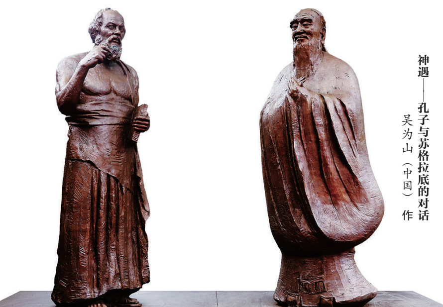
神遇——孔子与苏格拉底的对话 吴为山(中国) 作