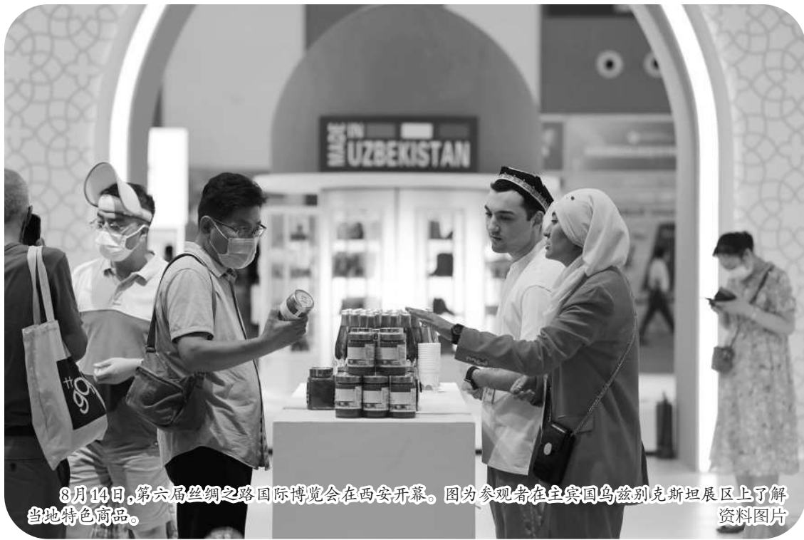
8月14日，第六届中国—中亚国家博览会暨中国—中亚国家博览会开幕式在西安开幕。图为参观者在乌兹别克斯坦展区上了解当地特色商品。

2013年秋天，国家主席习近平提出“一带一路”倡议，9年后的今天，“一带一路”已经成为最受欢迎的国际公共产品和最大规模的国际合作平台。在中国，广大民营企业积极响应国家号召，不断加快走出去步伐，成为高质量共建“一带一路”的生力军。日前，全国工商联主办首届民营企业共建“一带一路”峰会，畅谈民企走出去成绩，传播民企深耕“一带一路”的信心，喜迎党的二十大胜利召开。