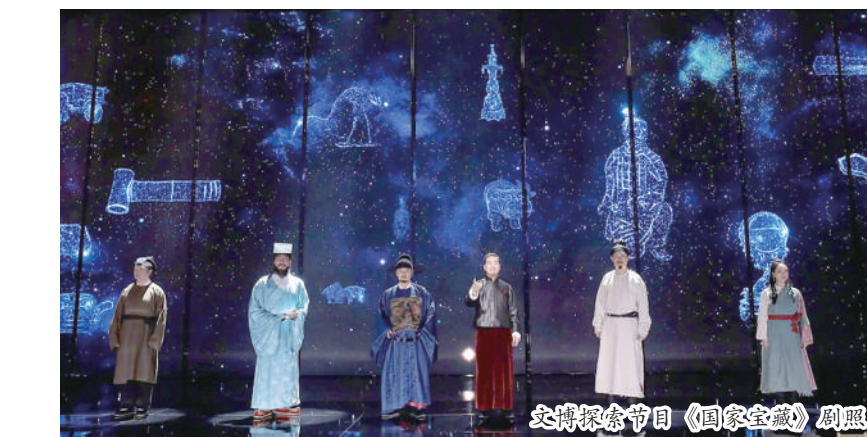
文博探索节目《国家宝藏》剧照

给中国国家博物馆老专家的回信中明确提出,推动文物活化利用。在文博领域实现传统文化的创造性转化创新性发展,归根结底在于文物走出库房后如何更好地与观众见面。“一件文物从库房走到展厅,如何充分挖掘它的价值,让观众深入了解与了解,需要探索如何更好地将它背后故事讲解出来。”全国政协委员,中国国家博物馆馆长王春法结合国家博物馆相关举措侃侃而谈:通过虚拟展览方式,打破传统展览的时空限制,让观众随时随地都能欣赏文物器物之美和了解它背后的故事;提取一些文化元素,用舞台剧表演、文创研发等方式呈现文物故事。