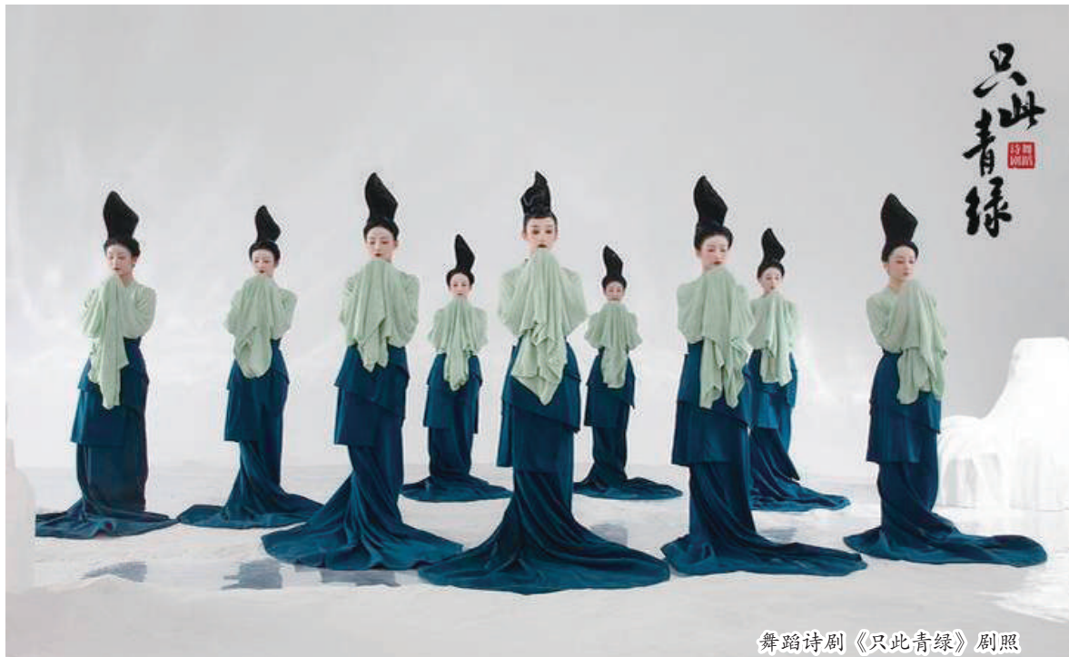
舞蹈诗剧《只此青绿》剧照