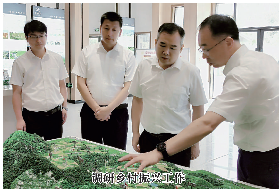
8月8日，湖北省鄂州市政协组织部分政协委员深入基层一线调研乡村振兴工作，围绕争创全国城乡融合发展示范区提出有针对性的意见和建议。

王荣表示，省政协要抓住关键“小切口”，做实建言“大文章”，围绕推进广东省“双碳”工作深入调查研究，提出具有前瞻性针对性的意见建议，为广东经济高质量发展贡献智慧和力量。