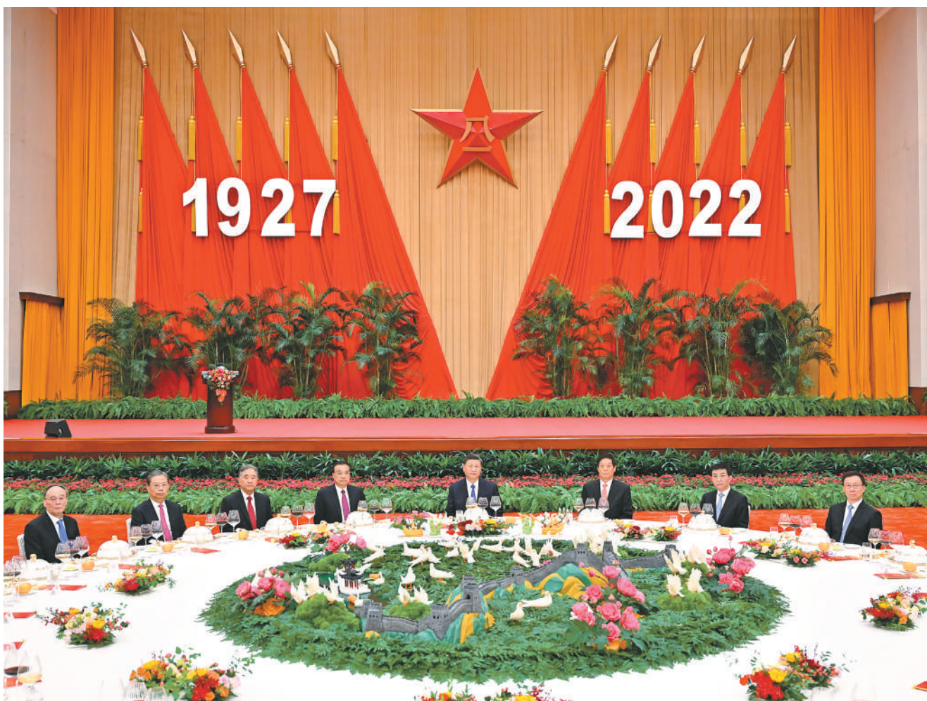
7月31日，中华人民共和国国防部在北京人民大会堂举行盛大招待会，热烈庆祝中国人民解放军建军95周年。中共中央总书记、国家主席、中央军委主席习近平和李克强、栗战书、汪洋、王沪宁、赵乐际、韩正、王岐山等党和国家领导人出席招待会。

魏凤和指出，新时代新征程上，全军必须以习近平新时代中国特色社会主义思想为指导，深入贯彻习近平强