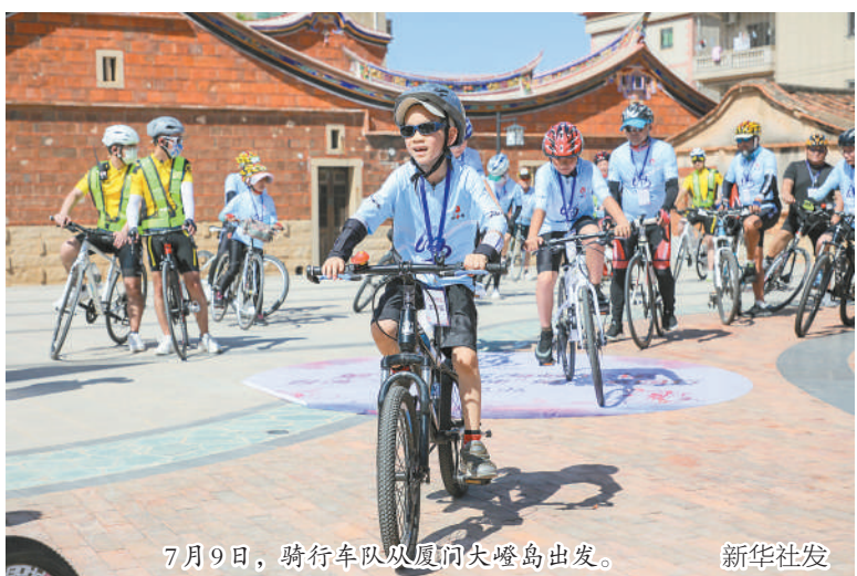
7月9日,骑行车队从厦门大嶝岛出发。