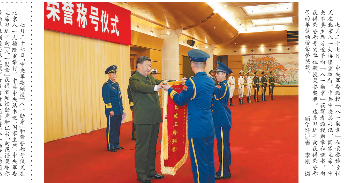
中央军委副主席张又侠主持仪式。杜富国、钱七虎、聂海胜等获得“八一勋章”的同志依次上前，习近平为他们佩戴勋章、颁发证书，同他们合影留念。随后，习近平向获得“模范地空导弹营”荣誉称号的空军地空导弹兵某部二营颁授荣誉奖旗。