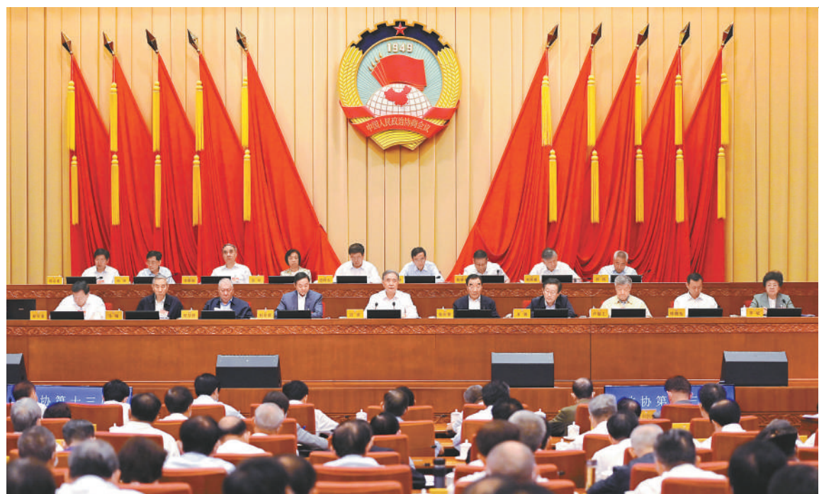
六月二十二日,政协第十三届全国委员会常务委员会第二十二次会议在北京闭幕。中共中央政治局常委、全国政协主席汪洋主持闭幕会并讲话。

汪洋强调,实现绿色低碳高质量发展的根本出路,是贯彻新发展理念,走创新驱动发展之路。要抓住科技创新这个“牛鼻子”,打好减排降碳关键核心技术攻坚战,统筹推进政策创新、管理创新、商业模式创新和体制机制创新。要坚持以人民为中心,稳中求进、先立后破,统筹把握多目标下的动态平衡,在减排降碳的同时确保能源安全、粮食安全、产业链安全,确保宏观经济大局稳定和群众正常生产生活,走出一条具有中国特色的绿色低碳高质量发展之路。政协委员要积极传播生态文明理念,带头践行绿色生产生活方式,广泛凝聚思想共识。