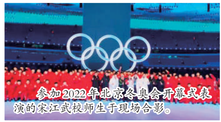
参加2022年北京冬奥会开幕式表演的宋江武校师生于现场合影。