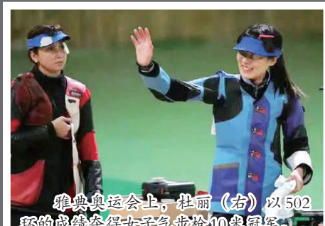
雅典奥运会上,杜丽(右)以502环的成绩夺得女子气步枪10米冠军。