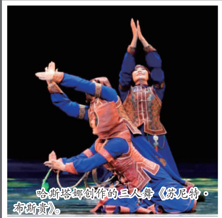
哈斯塔娜创作的三人舞《苏尼特·布斯贵》。