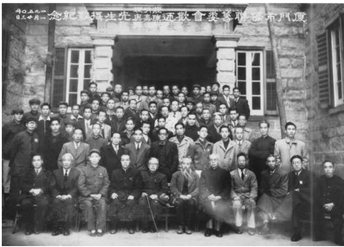
侨联筹委会欢迎参加北京开国大典的陈嘉庚先生(前排左五)