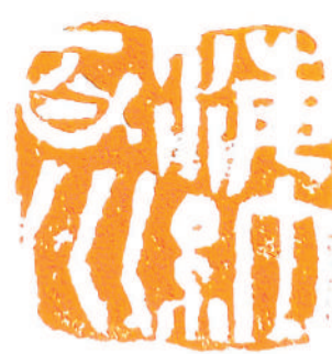
海纳百川 篆刻 高风 制