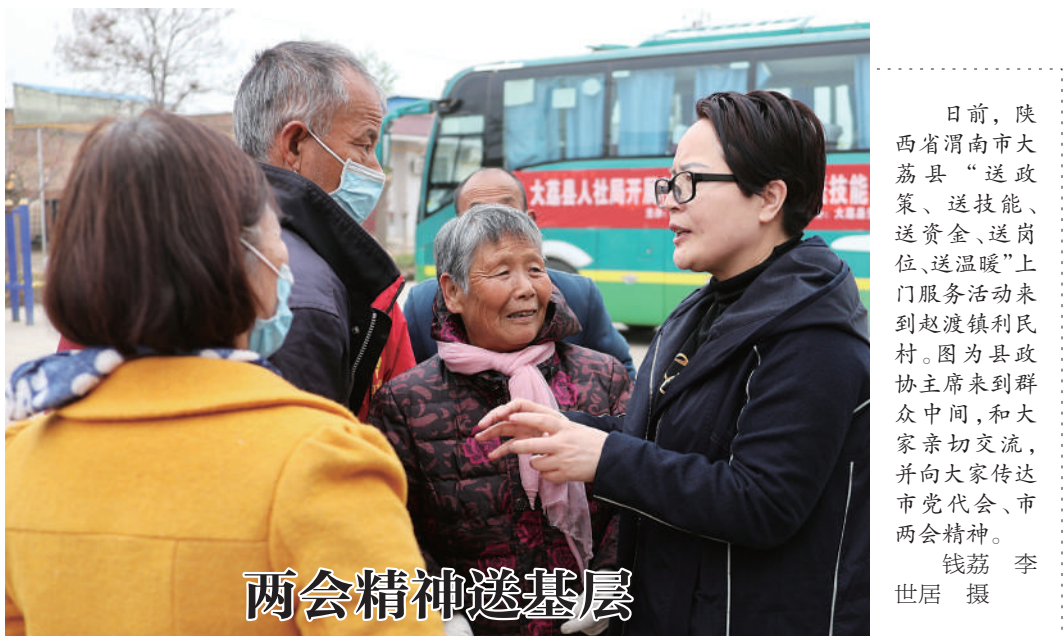
日前，陕西省渭南市大荔县“送政策、送技能、送资金、送岗位、送温暖”上门服务活动来到赵渡镇民利村。图为县政协主席来到群众中间，和大家亲切交流，并向大家传达市党代会、市两会精神。

在各方努力下，广大市民自觉开展垃圾分类投放，从“要我分类”变为“我要分类”，生活垃圾的减量化、资源化、无害化的水平进一步提升，有力促进了海南国家生态文明试验区建设。