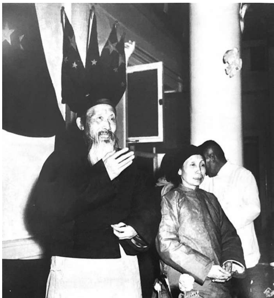
1951年3月31日晚,张澜在中央人民政府祝寿会上致答谢词。

4月2日是张澜诞辰150周年纪念日。这位被开国领袖毛泽东誉为“与日俱进”的先贤生于1872年(清同治十一年)4月2日(农历二月二十五日),参与创建了中国民主同盟并长期担任主席,新中国成立后,担任中央人民政府副主席、全国人大副委员长、全国政协副主席。他的志行学问、道德文章影响了无数渴望祖国富强的有识之士,开国元勋都尊称他为“表老”。1955年2月9日,他与世长辞,享年83岁。