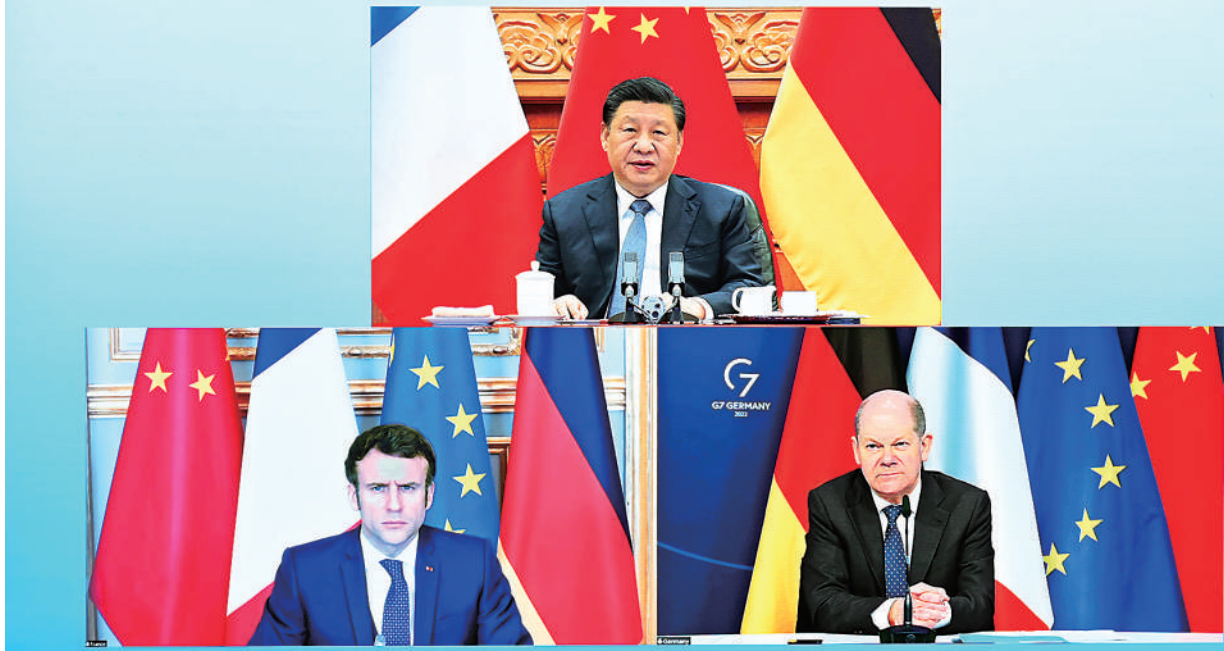
新华社北京3月8日电 国家主席习近平3月8日下午在北京同法国总统马克龙、德国总理朔尔茨举行视频峰会。

习近平指出，当今世界，百年变局和世纪疫情交织，带来很多全球性挑战，需要全球性合作。中欧在谋和平、促发展、促合作方面有很多共同语言。我们要拿出担当，为动荡变化的世界注入更多稳定性和确定性。双方要加强对话，坚持合作，推动中欧关系行稳致远。中国的发展将为中欧合作带来更大空间。双方要继续本着互利共赢原则，持续深化绿色、数字伙伴关系和各领域务实合作。双方要继续坚持多边主义，推进重大全球性议程。