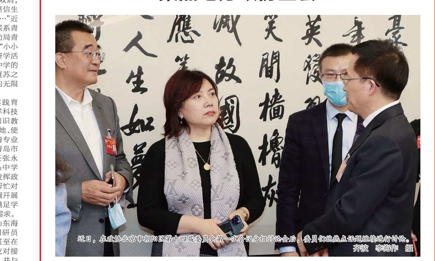
近日,在政协北京市朝阳区第十四届委员会第一次会议分组讨论会后,委员们就热点问题继续进行讨论。