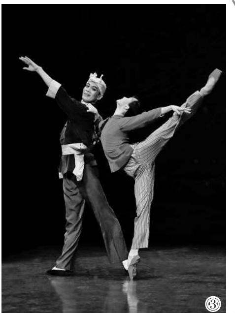
图①：民族芭蕾舞剧《宝塔山》剧照 图②：芭蕾舞剧《茶花女》剧照 图③：经典芭蕾舞剧《白毛女》剧照