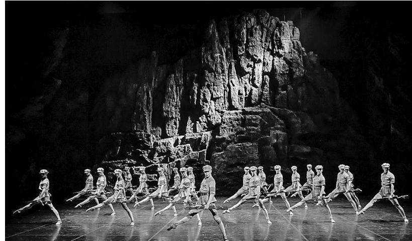
▲原创芭蕾舞剧《闪闪的星星》剧照

《睡美人》等制作精良的大型作品，《茶花女》等作品在中国舞蹈荷花奖、上海白玉兰戏剧奖中斩获佳