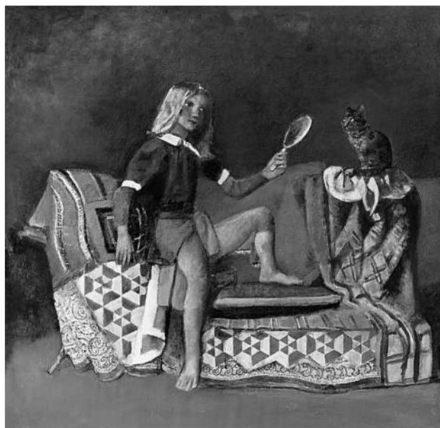
巴尔蒂斯 (1908-2001) 《镜子里的猫Ⅲ》 (1989-1994年作) 布面油画

日前,永乐秋拍携重磅佳作亮相,其中巴尔蒂斯创作的一幅大尺幅《镜子里的猫Ⅲ》领衔夜场。