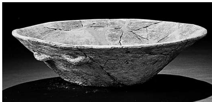
陶盆 新石器时代·上山文化(距今约11000-8500年) 浙江省义乌桥头遗址出土

上山文化陶盆出土于浙江省义乌桥头遗址,陶盆口径35厘米,底径10厘米,高9厘米,是上山文化最具标识性的器物之一。