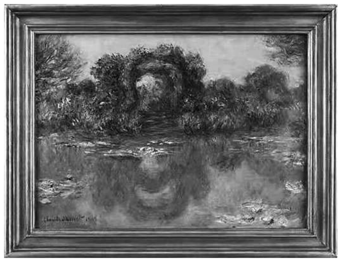
克劳德·莫奈 《睡莲池与玫瑰》 布面 油画 73×100cm

另一件莫奈的力作《台阶》以2875万元成交。此件作品创作于1878年,是莫奈创作转型时期的经典之作。此年夏日,莫奈搬至巴黎北郊,绘画内容从现代都市之景变为乡间自然野趣;旷野骄阳之下的色彩也异于画家早期表达习惯,此一时期莫