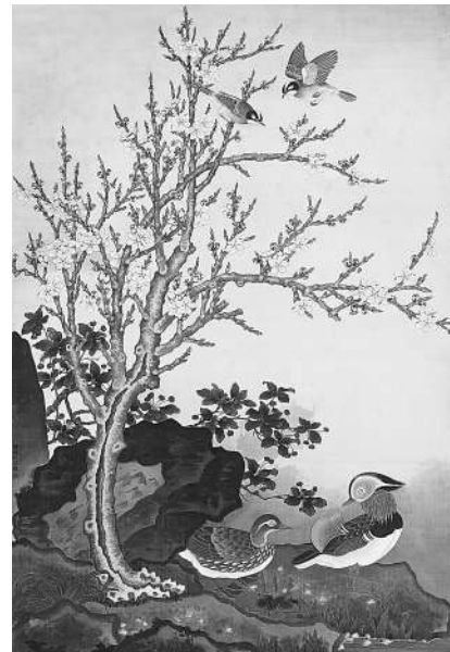
陈佩秋《鸳鸯杏花》 设色绢本 镜框 115×75cm 1958年作

此次展览涵盖了陈佩秋20世纪50-70年代之后直至晚年的花鸟、山水等题材作品。20世纪50年代时,陈佩秋专攻花鸟,取法两宋,用工笔双勾,赋以重彩,作品既有宋人的遒劲鲜艳,又有纯净雅洁的格调。谢定伟说: