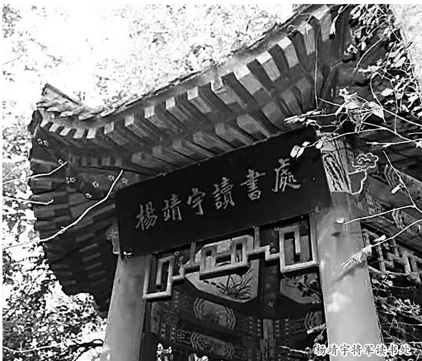
杨靖宇将军读书处