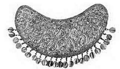
东汉月牙形金饰牌 通高21.8厘米,高13.6厘米 内蒙古博物院藏

此月牙形金饰牌制作相当精美,从纹饰、工艺、器形上看,与阿富汗西伯尔罕黄金冢出土的金器较为相似,代表了草原文化的工艺特征。