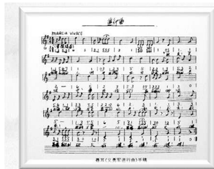
▲聂耳谱曲的《义勇军进行曲》手稿

当时我在会上接过话筒发表了意见，我说：“我作为解放军军乐团的常任指挥，对中外国歌有一些了解，世界