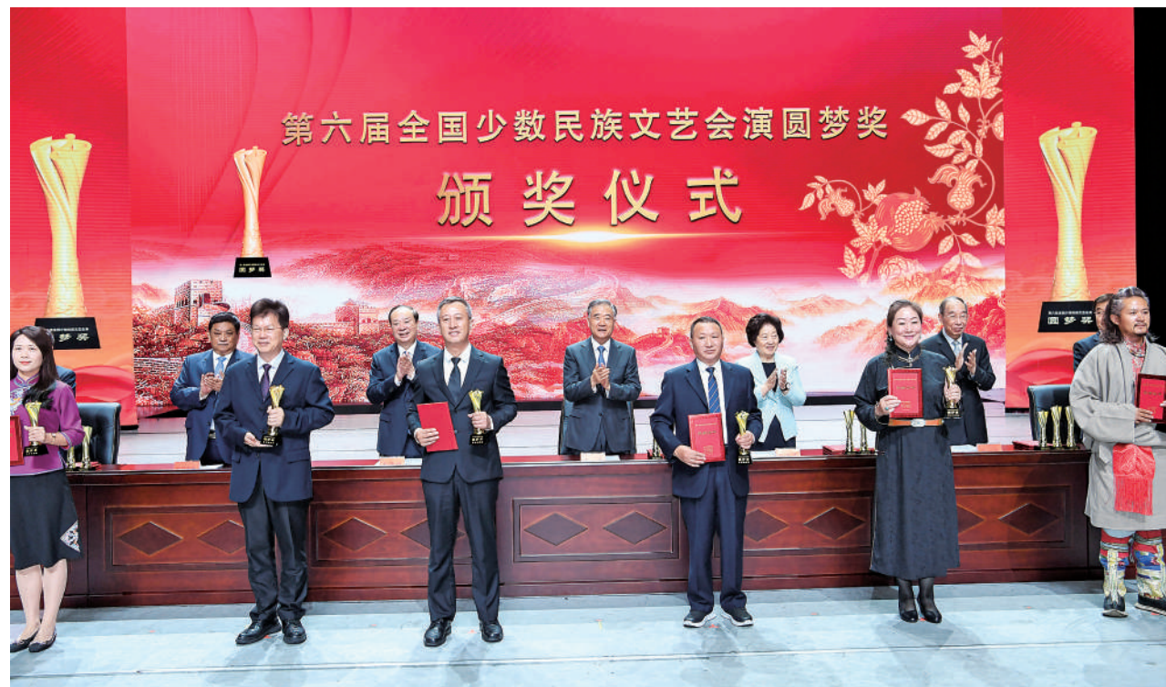
9月24日晚，历时近一个月的第六届全国少数民族文艺会演在北京民族剧院落下帷幕。中共中央政治局常委、全国政协主席汪洋出席颁奖仪式暨闭幕式文艺晚会，并为获奖集体和个人代表颁奖。

新华社北京9月24日电 历时近一个月的第六届全国少数民族文艺会演24日晚在北京民族剧院落下帷幕。中共中央政治局常委、全国政协主席汪洋出席颁奖仪式暨闭幕式文艺晚会，并为获奖集体和个人代表颁奖。 本届文艺会演剧目以习近平总书记关于加强和改进民族工作的重要思想为指导，以庆祝中国共产党建党100周年为主题，以铸牢中华民族共同体意识为主线，围绕民族团结、脱贫攻坚、绿色发展、援藏援疆等内容，用艺术的形式讴歌党、讴歌祖