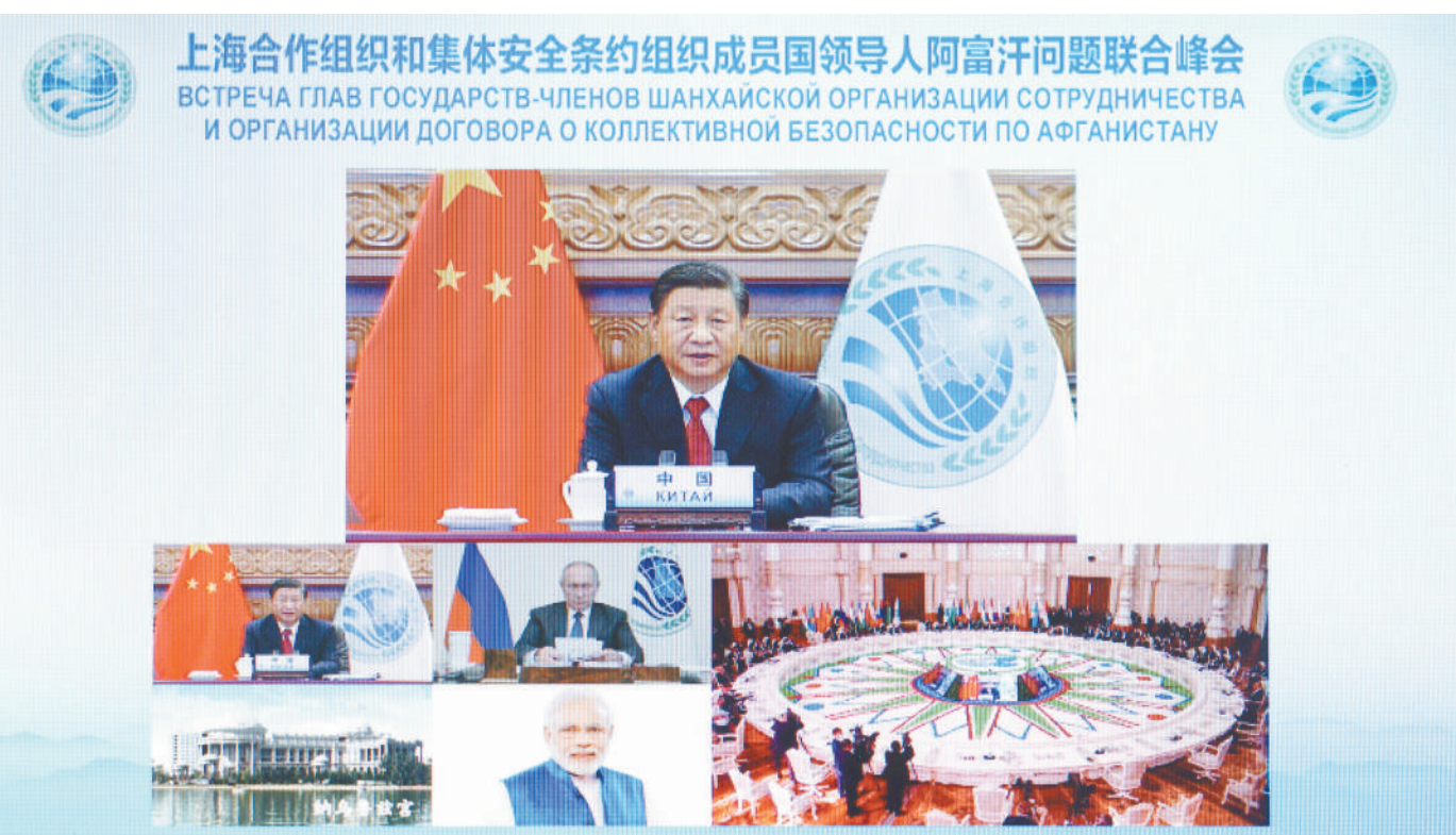
9月17日,国家主席习近平在北京以视频方式出席上海合作组织和集体安全条约组织成员国领导人阿富汗问题联合峰会并发表重要讲话。

新华社北京9月17日电 国家主席习近平17日下午在北京以视频方式出席上海合作组织和集体安全条约组织成员国领导人阿富汗问题联合峰会并发表重要讲话。 习近平指出,近期,阿富汗局势发生根本性变化,对国际形势、地区格局和安全稳定产生重要影响。目前,阿富汗面临不少困难和挑战,尽快恢复正常秩序,实现局势软着陆,是全体阿富汗人民的紧急要务,国际社会和地区国家也需要密切关注。上海合作组织和集体安全条约组织成员国都是阿富汗