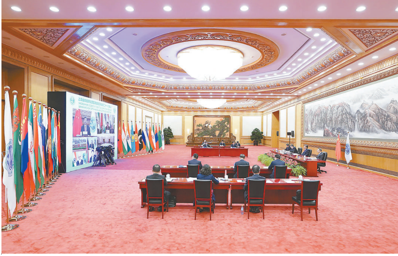
9月17日,国家主席习近平在北京以视频方式出席上海合作组织成员国元首理事会第二十二次会议并发表重要讲话。

新华社北京9月17日电 国家主席习近平17日下午在北京以视频方式出席上海合作组织成员国元首理事会第二十二次会议并发表题为《不忘初心 砥砺前行 开启上海合作组织发展新征程》的重要讲话。(讲话全文另发)