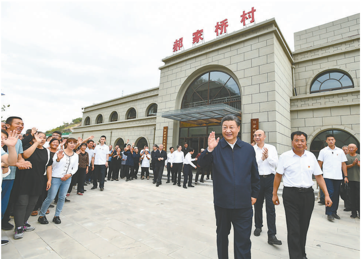
9月13日至14日, 中共中央总书记、国家主席、中央军委主席习近平在陕西省榆林市考察。这是14日下午, 习近平在绥德县张家砭镇郝家桥村考察时, 向乡亲们挥手致意。

新华社榆林9月15日电 中共中央总书记、国家主席、中央军委主席习近平近日在陕西省榆林市考察时强调, 要坚决落实党中央决策部署, 坚持稳中求进工作总基调, 完整、准确、全面贯彻新发展理念, 弘扬光荣革命传