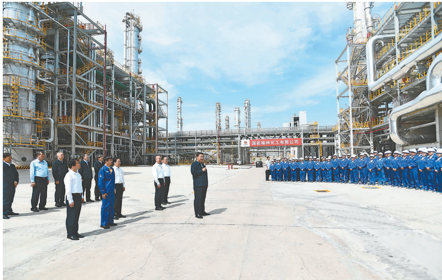
9月13日至14日, 中共中央总书记、国家主席、中央军委主席习近平在陕西省榆林市考察。这是13日上午, 习近平在国家能源集团榆林化工有限公司考察时, 同企业职工代表亲切交流。