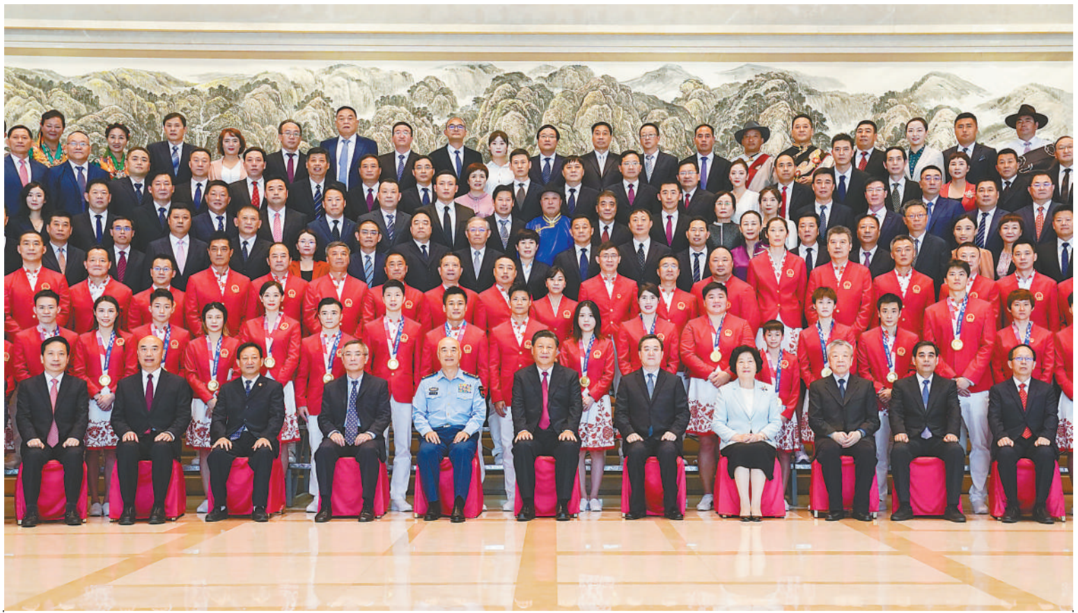
9月15日, 中共中央总书记、国家主席、中央军委主席习近平在陕西省西安市亲切会见全国群众体育先进单位、先进个人代表和全国体育系统先进集体、先进工作者代表, 东京奥运会中国体育代表团运动员和教练员代表等, 同大家合影留念。

新华社西安9月15日电 中华人民共和国第十四届运动会15日晚在陕西省西安市隆重开幕。中共中央总书记、国家主席、中央军委主席习近平出席开幕式并宣布运动会开幕。15日晚的西安奥体中心体育场灯光璀璨, 气氛热烈。19时58分, 在欢快的乐曲声中, 习近平和夫人彭丽媛等走上主席台, 向观众挥手致意。全场响起长时间热烈的掌声。20时, 第十四届全运会开幕式正式开始。伴着《歌唱祖国》的激昂旋律, 仪仗队员护拥着鲜