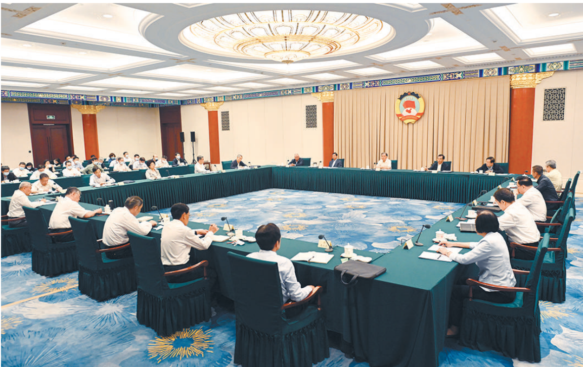
8月16日, 全国政协2021年度主席会议成员务虚会在北京召开。会议认真学习贯彻习近平总书记“七一”重要讲话精神, 落实习近平总书记关于加强和改进人民政协工作的重要思想, 围绕做好新时代政协民主监督工作交流研讨。中共中央政治局常委、全国政协主席汪洋主持会议并讲话。