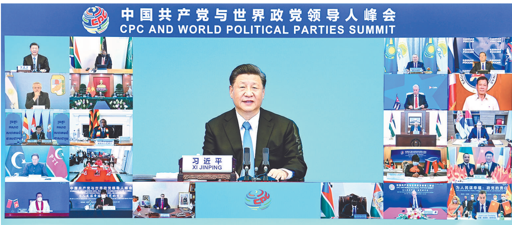
7月6日，中共中央总书记、国家主席习近平在北京出席中国共产党与世界政党领导人峰会并发表主旨讲话。