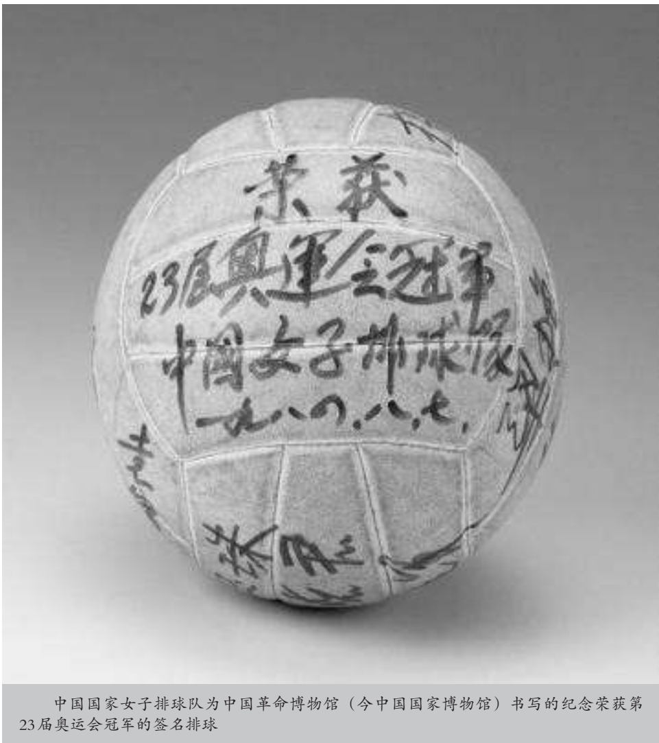
中国国家女子排球队为中国革命博物馆(今中国国家博物馆)书写的纪念荣获第23届奥运会冠军的签名排球

1982年,中国女排获得世锦赛冠军后,袁伟民曾说:“世界排坛最高的荣誉奖是‘三连冠’。所以在秘鲁世锦赛后,我们女排全体同志,每时每刻都在想,怎样实现全国人民的愿望,要夺‘三连冠’,即一定要拿下洛杉矶奥运会的冠军。”1984年奥运会是洛杉矶时隔52年后第二次举办奥运会。洛杉矶第一次举办奥运会时,中国只派出了短跑运动员刘长春参赛。由于准备不足加上旅途劳顿,刘长春未能发挥出应有的水平。刘长春的失利引来了诸多外国媒体的嘲讽。1984年,当中国奥运代表团再次踏入这座城市时,射击队的许海峰为中国实现了奥运金牌“零的突破”。许海峰这枚宝贵的金牌大大提升了中国代表团的士气,中国女排的姑娘们也深受鼓舞。小组赛,中国女排以两个3比0先后战胜了巴西和联邦德国队。但是,随后却以1比3输给了美国队。