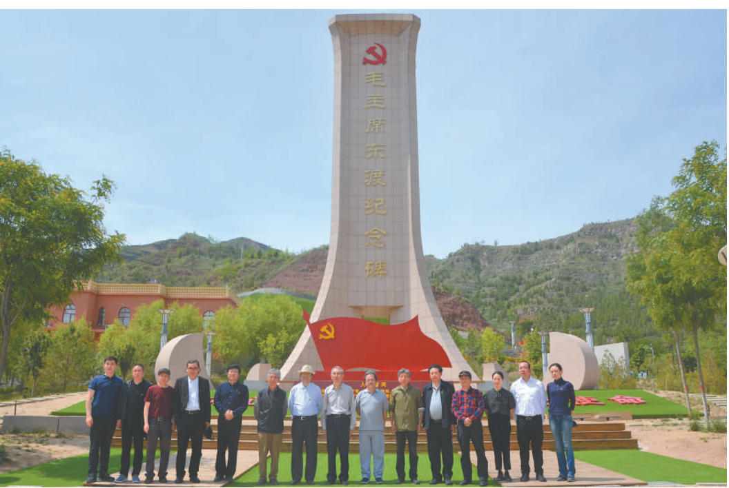
▲在毛主席东渡纪念碑前合影