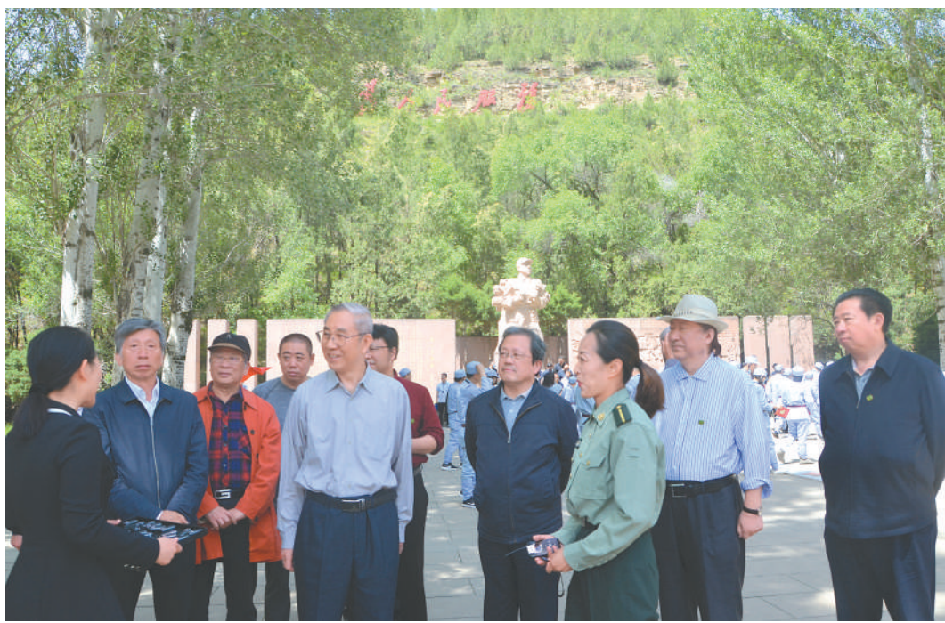
▲在《为人民服务》讲话纪念广场开展党史学习教育

当天，正好是毛泽东同志在延安文艺座谈会闭幕会上作重要讲话79周年的日子。79年前毛泽东同志发表了《在延安文艺座谈会上的讲话》，奠定了党的文艺理论和方针政策的基础。2014年10月习近平总书记主持召开文艺工作座谈会并发表重要讲话，为新时代文艺发