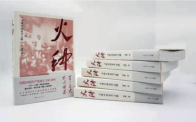
《火种——寻找中国复兴之路》