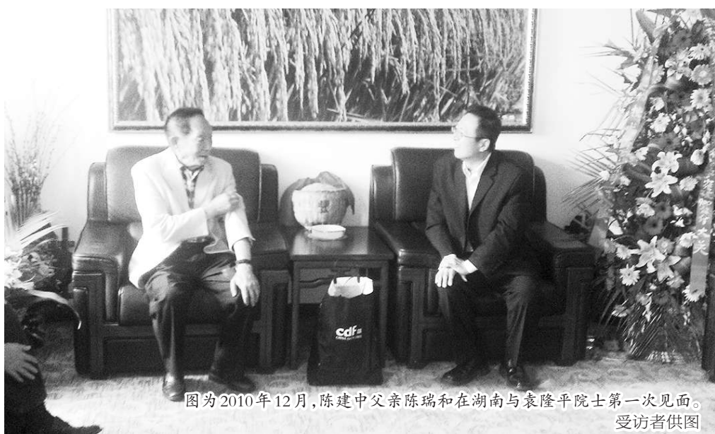
图为2010年12月,陈建中父亲陈瑞和在湖南与袁隆平院士第一次见面。

“怎么可能?!袁老师身体那么硬朗,整个人状态那么好!”5月22日,从大陆合作伙伴——湖南隆平高科一位高管处得知杂交水稻之父、中国工程院院士袁隆平先生去世的消息,台商陈建中最初有点不相信自己的眼睛,盯着大陆这位合作伙伴的微信消息,他又逐字确认了一遍。