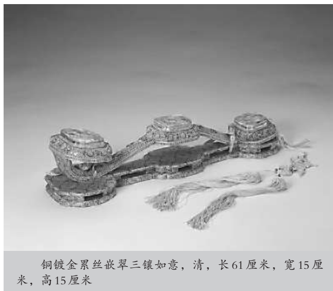
铜镀金累丝嵌翠三镶如意，清，长61厘米，宽15厘米，高15厘米

三镶如意的形制最初创作于清乾隆时期，多见竹木材质，后因流行于世，开始扩展到其他材质，出现了金属三镶如意、牙角雕三镶如意等类型，所嵌之物也不仅限于玉，也出现嵌松石、红蓝宝石等。后来，还产生出了只镶首尾的两镶如意和只镶柄首的单镶如意等。