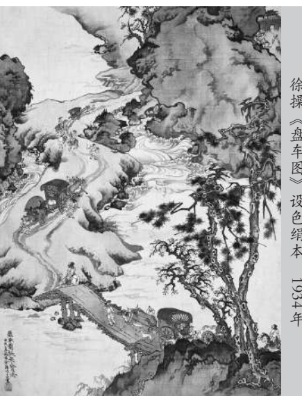
徐操《盘车图》设色绢本 1934年

“现当代油画雕塑”专场共推出95件拍品，其中，艺术家家属提供的孙宗慰《人物(赴庙会途中)》，是孙宗慰系列画中的精品，画面中，孙宗慰仅用几根准确、轻松的线条便将人物动态勾勒得惟妙惟肖，可以看出敦煌壁画对孙宗慰艺术创作的直接影响，同时，画家对于色彩的把握也颇见功力，全幅色彩鲜艳、饱满，丝毫没有庸俗之气，色彩节奏明快却不轻浮，浓郁却不突兀，展现了画家在色彩上敏锐的感知力与控制力。