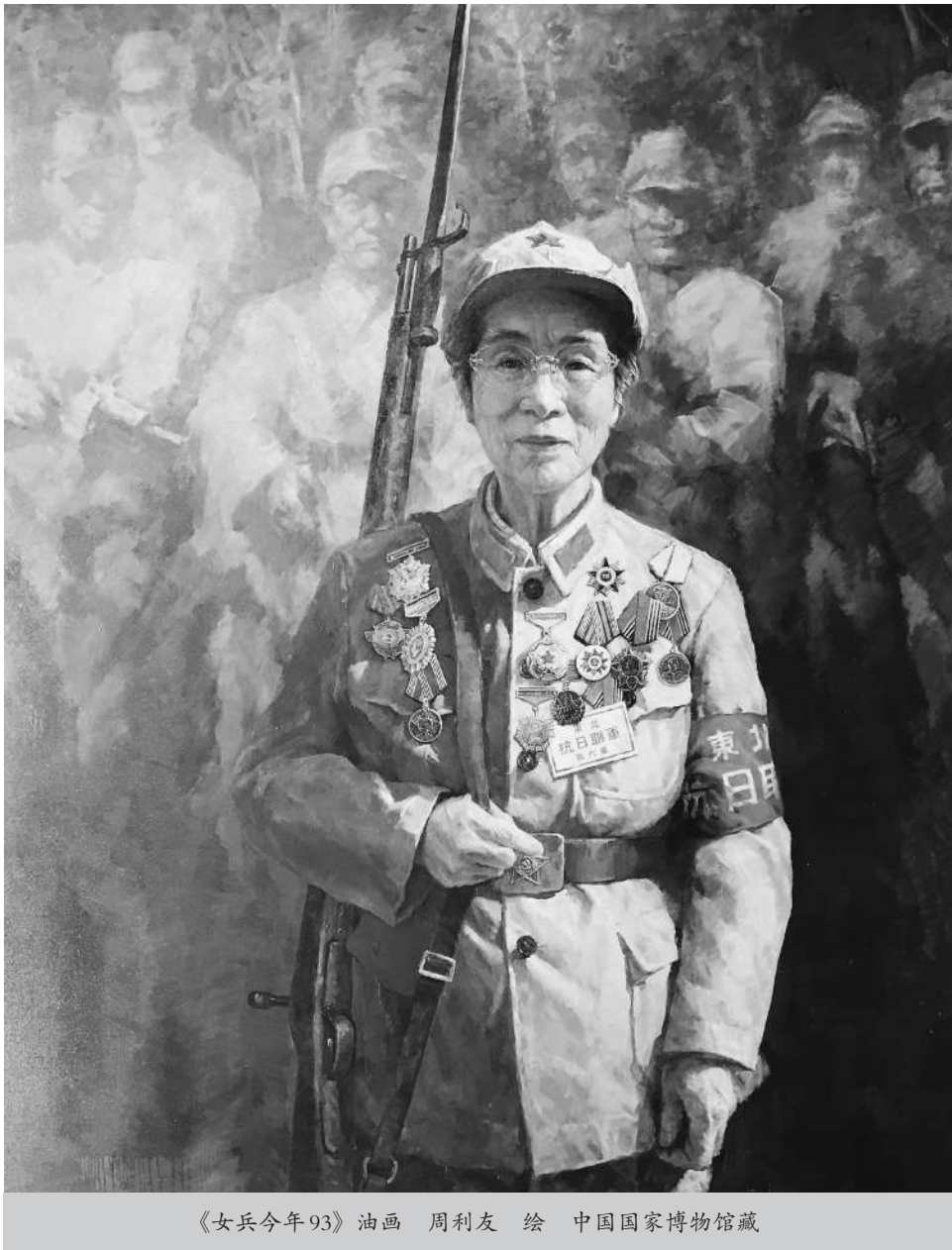
《女兵今年93》油画 周利友 绘 中国国家博物馆藏

在庆祝中国共产党成立100周年之际，中国国家博物馆新入藏了一批东北抗联女兵主题绘画作品。这批作品共5幅，由沈阳画家周利友创作，油画《女兵今年93》为其中之一。