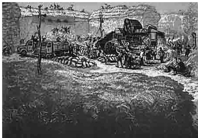
▲ 最后 一根钢梁 (套色木刻)

武石先生的作品质朴、简洁，充满了现实主义的感人力量，弥漫着强烈的中国精神。在此次捐赠的作品中，既有抗日救亡运动时期的《抗日何罪》《枪杆子里面出政权》等作品，也有反映新中国建设场景的《最后一根钢梁》《小麦丰收》等套色木刻，还有多次重走战地路线时创作的《白桦湾》《三五九旅与敌恶战于荆紫关》等山水画作品及众多花鸟作品，充分体现了武石先生的家国情怀和责任担当。武石不同时期的100余件作品入藏国家博物馆，不仅丰富了国家博物馆在反映革命文化和社会主义先进文化方面的馆藏类型，更有利于对红色经典美术作品的深入研究和系统展示。