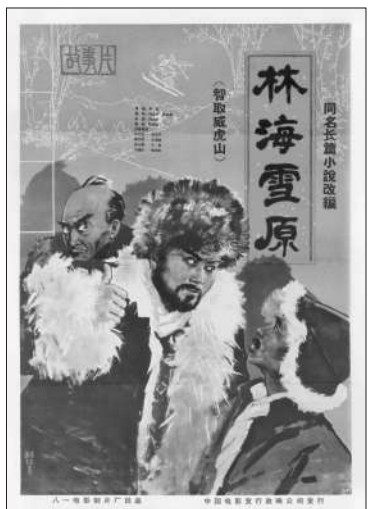
《林海雪原》电影海报