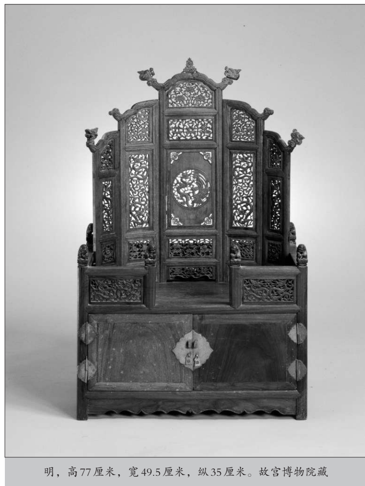
明，高77厘米，宽49.5厘米，纵35厘米。故宫博物院藏

故宫博物院藏明代黄花梨木雕凤纹五屏风式镜台整体分为屏风、镜台两部分，均为黄花梨木制成。其中，台座以上为五屏式，雕刻图案以龙、凤、莲、狮纹为主。屏风脚穿座面直插，中扇最高，向左右递减，并依次向前兜转。