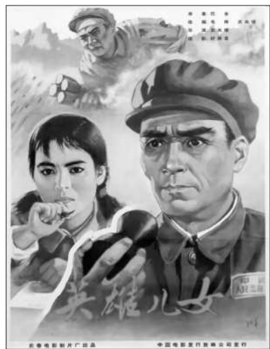
《英雄儿女》电影海报

本报讯（记者 付裕）主题为“峥嵘岁月 红色记忆”的新中国红色电影海报展日前亮相沁园。此次展览遴选了新中国成立以来60多种电影海报，其中包括《白毛女》《红色娘子军》《平原游击队》《小兵张嘎》《地道战》《林海雪原》《董存瑞》《英雄儿女》等脍炙人口的红色经典电影海报，呈现了难以忘怀的革命岁月、热火朝天的建设年代和波澜壮阔的改革历程。