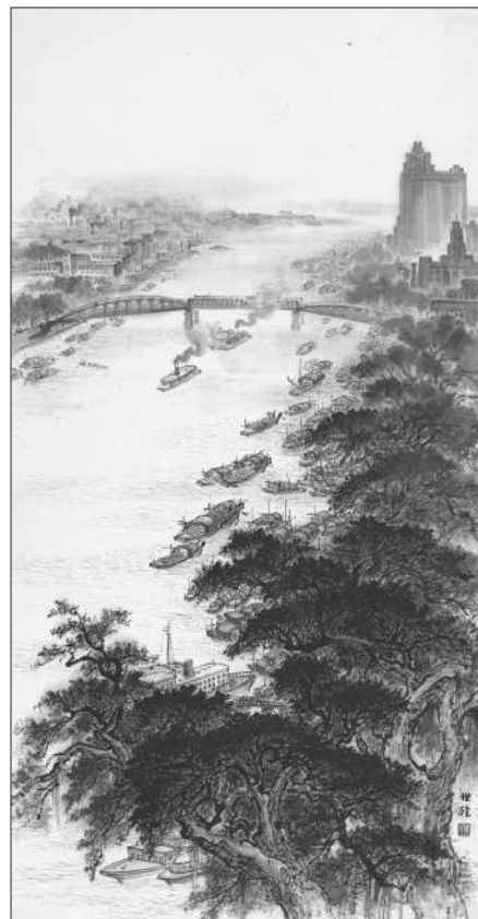
珠江晓雾，梁世雄，1962年。关山月美术馆藏

作为一位具有69年党龄的老党员，梁世雄曾多次将个人的精品力作捐赠给国家，体现了共产党人的无私奉献精神和高尚情操。此次，他也将自己的部分精品力作捐赠给深圳市关山月美术馆。