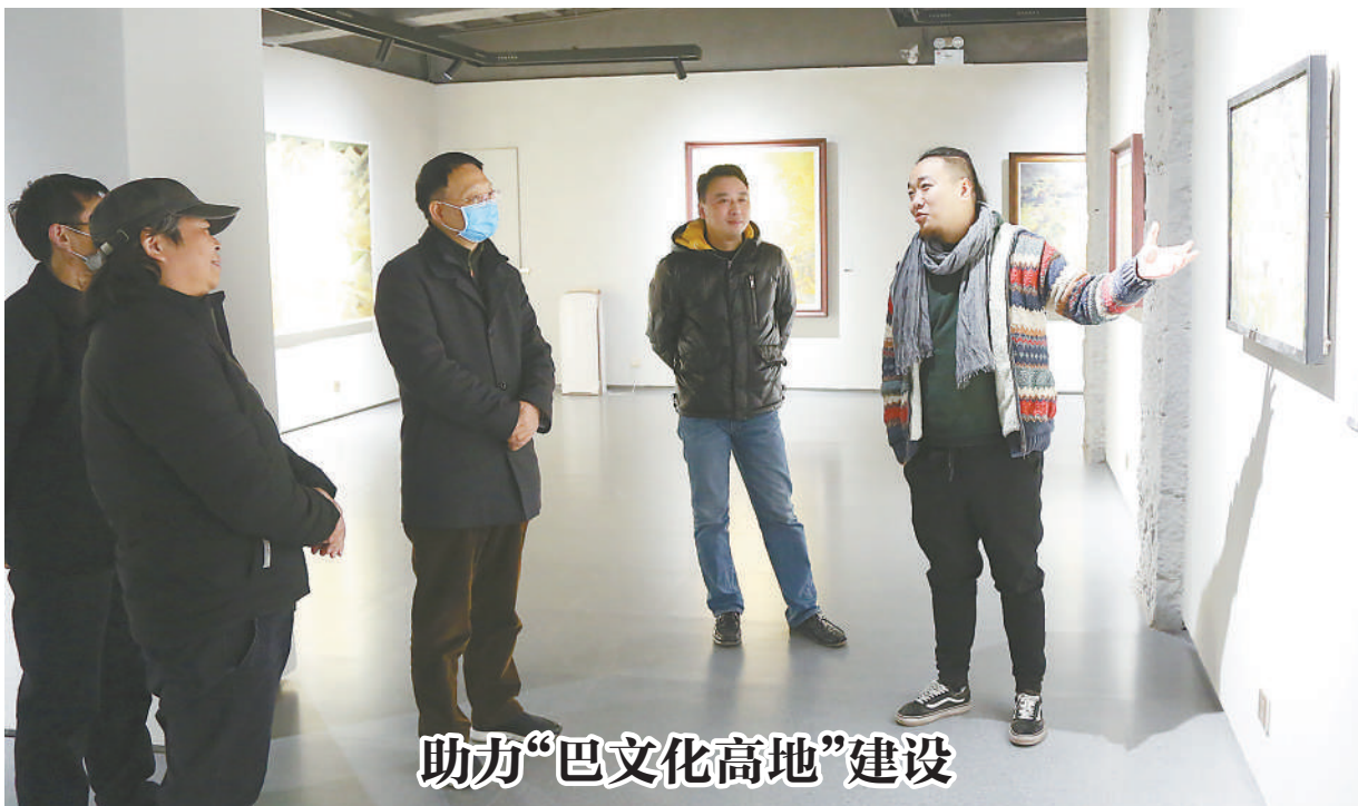
助力“巴文化高地”建设

南京市政协副主席吴卫国表示，就业是考核职业教育成功与否的关键。他建议优化师资队伍，完善培养体系，扩大职业院校用人自主权，将“大国工匠”“能工巧匠”吸纳到职业教育师资队伍中来，搭建人才成长“立交桥”。