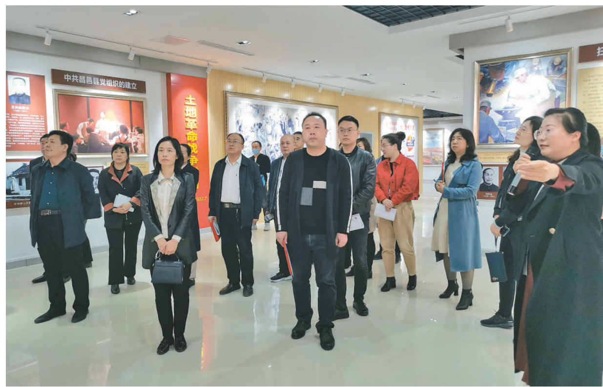
近日，山东省昌邑市政协积极开展党史学习教育主题实践活动，组织委员到市党史馆、徐迈事迹陈列馆等地参观学习，汲取党史营养，强化党性原则，赓续精神血脉，进一步激发委员们的爱国情怀和履职热情。

信”、做到“两个维护”，切实提高党史学习教育的质量和成效。要切实加强对组织学习，高标准安排、高质量推进、高要求落实好各项任务要求，推动自主学习、集中学习、现场教学、线上学习等各项活动有序有力有效开展。坚持守正创新，进一步丰富形式和内容，不断把学习教育引向深入。把党史学习教育贯穿省政协视察调研等履职工作中，做到融入日常、抓在经常，用实际工作成效检验党史学习教育成果。