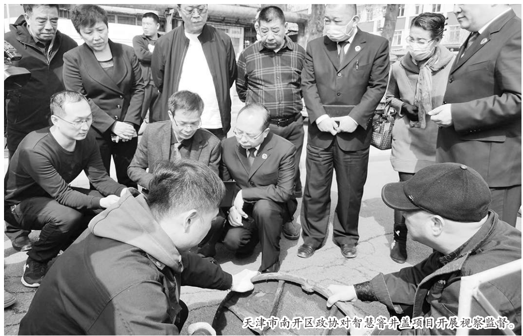
天津市南开区政协对智慧窨井盖项目开展视察监督。

政协建议代表了百姓呼声。区委、区政府和相关职能部门高度重视，将其作为惠及广大人民群众的民生工程，持续推进窨井盖安全隐患排查治理工作，针对不同问题分门别类及时进行维修加固、更换补装。同时探索推进传感器和物联网的城市窨井盖安全监管模式，实现了对窨井盖管理养护、防汛监测、安全防坠等在线监测，为居民安全出行筑起了坚强屏障，受到人民群众的点赞。