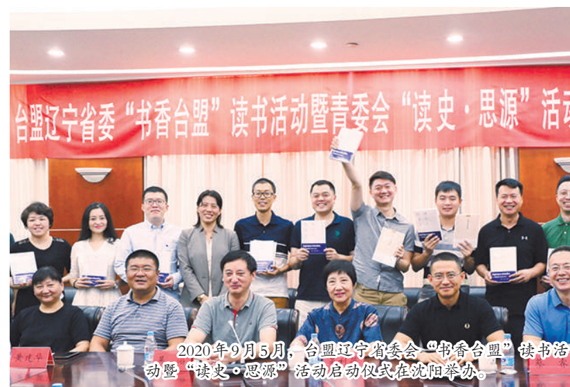
2020年9月5日,台盟辽宁省委“书香台盟”读书活动暨“读史·思源”活动启动仪式在沈阳举办。