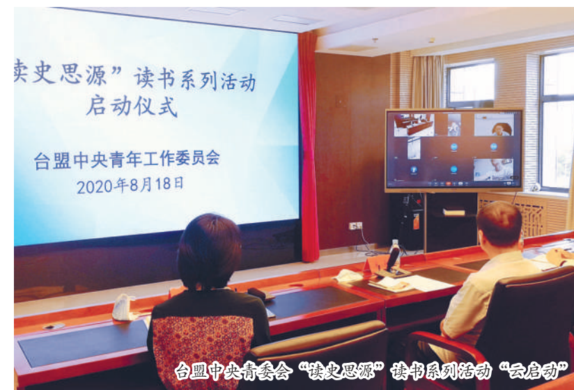
台盟中央青工委“读史思源”读书系列活动“云启动”