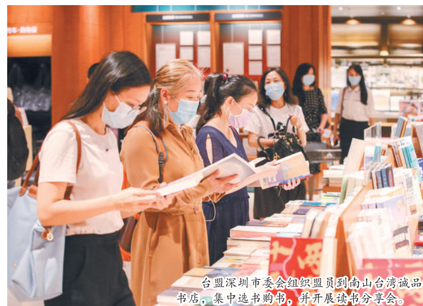
台盟深圳市委组织盟员到南山台湾诚品书店,集中选书购书,并开展读书分享会。