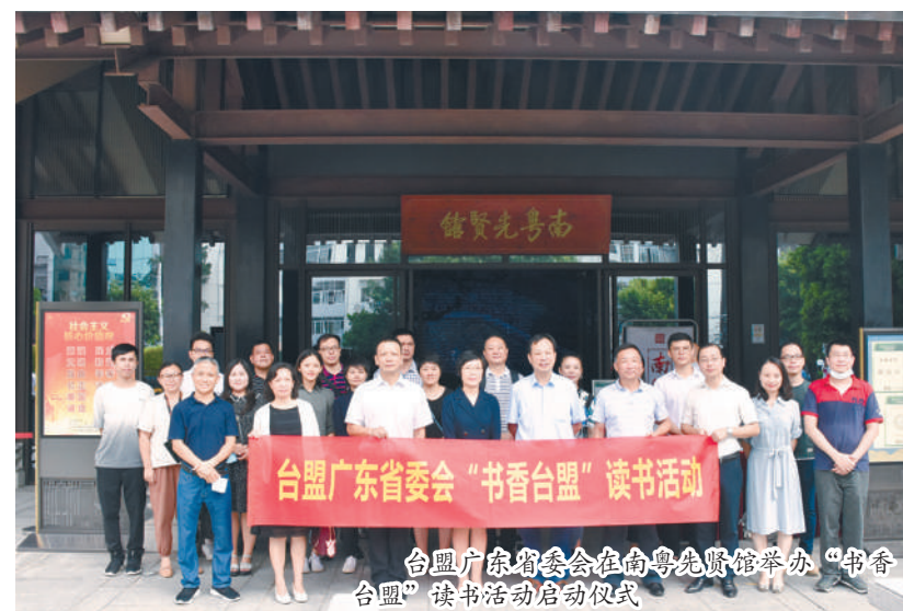
台盟广东省委在粤光贤馆举办“书香台盟”读书活动启动仪式