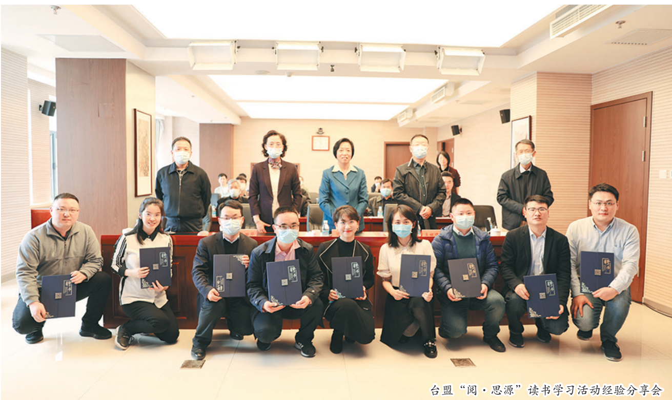
台盟“阅·思源”读书学习活动经验分享会

“耕读传家久,诗书继世长”,崇尚读书历来是中华民族的优良传统。对个人、社会、国家和民族而言,“第一件好事还是读书”。阅读不仅是修身养性、立德明志之本,也是文化传承、促进社会公平进步之基。党的十八大以来,中共中央高度重视全民阅读。习近平总书记多次在不同场合提及读书之道,分享读书感悟,提倡和鼓励大家多读书、读好书、善读书。