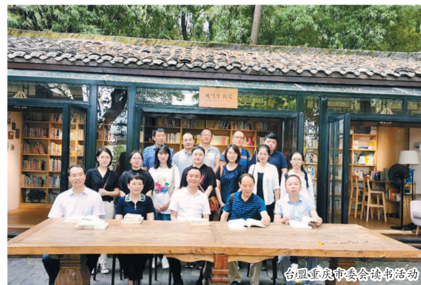
台盟重庆市委读书活动