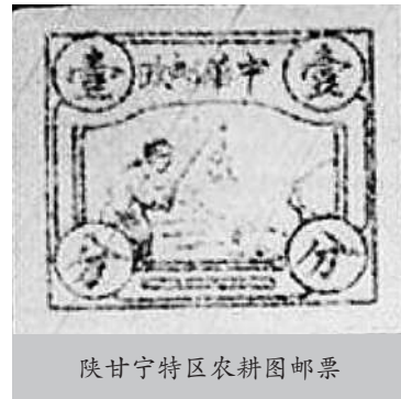
陕甘宁特区农耕图邮票

1937年5月，陕甘宁特区邮政管理局发行了一套邮票，全套2枚，其中一枚为“农耕图”，票面为白底绿色，面值1分，图案正中为一“凸”形大框，其正中偏左，绘有一人弯腰一手拿鞭，一手扶犁，偏右绘一牛，展现了一农民正在扬鞭催赶着牲畜耕地的情景。凸框上端为邮政铭记“中华邮政”四字，其“华”字为繁体，“邮”字却为简体，繁简体并用于苏区邮票传下来的，不多见。图案四角圆圈内，上端左右为两个“壹”字，下端左右为两个“分”字。邮票图幅23.5毫米×20毫米，黄亚光设计，在延安平版石印。不久又印制第二版，图案与第一次印制的相同，“中华邮政”四字比第一次印制的字体大一些。这枚邮票是研究解放区人民邮政史不可多得的实物佐证。