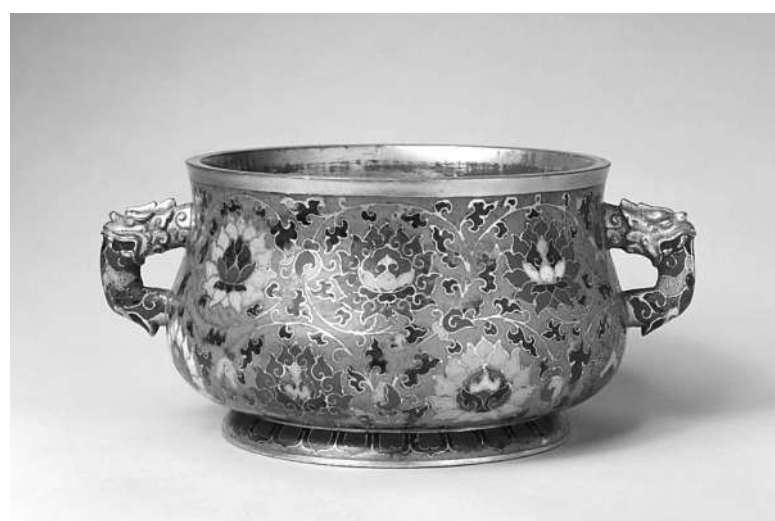
明掐丝珐琅缠枝莲纹炉 高9.7厘米 口径15厘米 足径12.3厘米 清宫旧藏

明代掐丝珐琅缠枝莲纹炉胎体厚重，造型规整，炉身以蓝色珐琅为地，饰掐丝缠枝莲纹二层，填红、黄、蓝、白等色，上下交错，灵巧生动，章法有度。此炉垂腹圆足，铜鎏金龙首吞彩色云纹双耳，足环饰红色蓝色莲瓣纹一周。