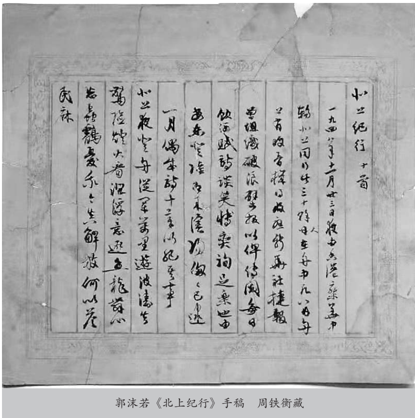
郭沫若《北上纪行》手稿 周铁衡藏

1948年11月23日夜，郭沫若、马叙伦、许广平等民主人士由时任中共香港工委副书记连贯陪同，乘坐悬挂着葡萄牙国旗的“华中号”货轮从香港秘密北上东北解放区，参与筹备新政协。