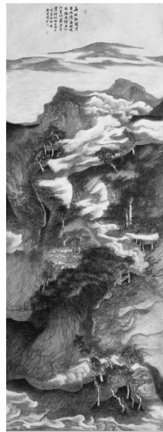
魏广君 倪雲林诗意图 215cm×77cm 2008年

中国国家画院院长卢禹舜表示，为了表达始终遵循与坚守“大道”的初心和决心，传达中国国家画院艺术家之间以艺传道、以艺接力、志同道合、薪火相传的精神，中国国家画院举办的“大道不孤——中国国家画院中青年艺术家邀请展”，以个展的形式，展出院中青年艺术家群体的创作成果。作为“大道不孤”系列展的第二个个展，魏广君以书入画，以画融书，书画并进，在书法、篆刻、绘画上所取得的成就，在当代产生了非常广泛的影响。他的艺术创作和实践对中华民族文化传统进行了深入研究，特别是对现实生活深入接触和实践，使得他的作品有道德、有情怀、有温度。