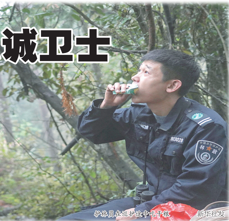
护林员在巡护途中吃干粮

有这么一群人，终日行走在群山峻岭之中，他们起早贪黑，披星戴月，日复一日用自己的脚步丈量着中国最美好的山林。为了守护祖国的绿色屏障，他们需要付出常人难以想象的艰辛与孤独；面对很多人的不理解，他们要用坚守和智慧化解矛盾；在脱贫攻坚的一线，他们用自己的一技之长，带动了一大批人走上增收致富路……近日，中央宣传部、国家林业和草原局、财政部、国务院扶贫办联合开展“最美生态护林员”学习宣传活动，推荐遴选出王明海、朱生玉、多贡等20位代表为“最美生态护林员”。记者从中选取了几位的事迹，以他们为代表，可以窥视到110.2万名生态护林员的真实故事——