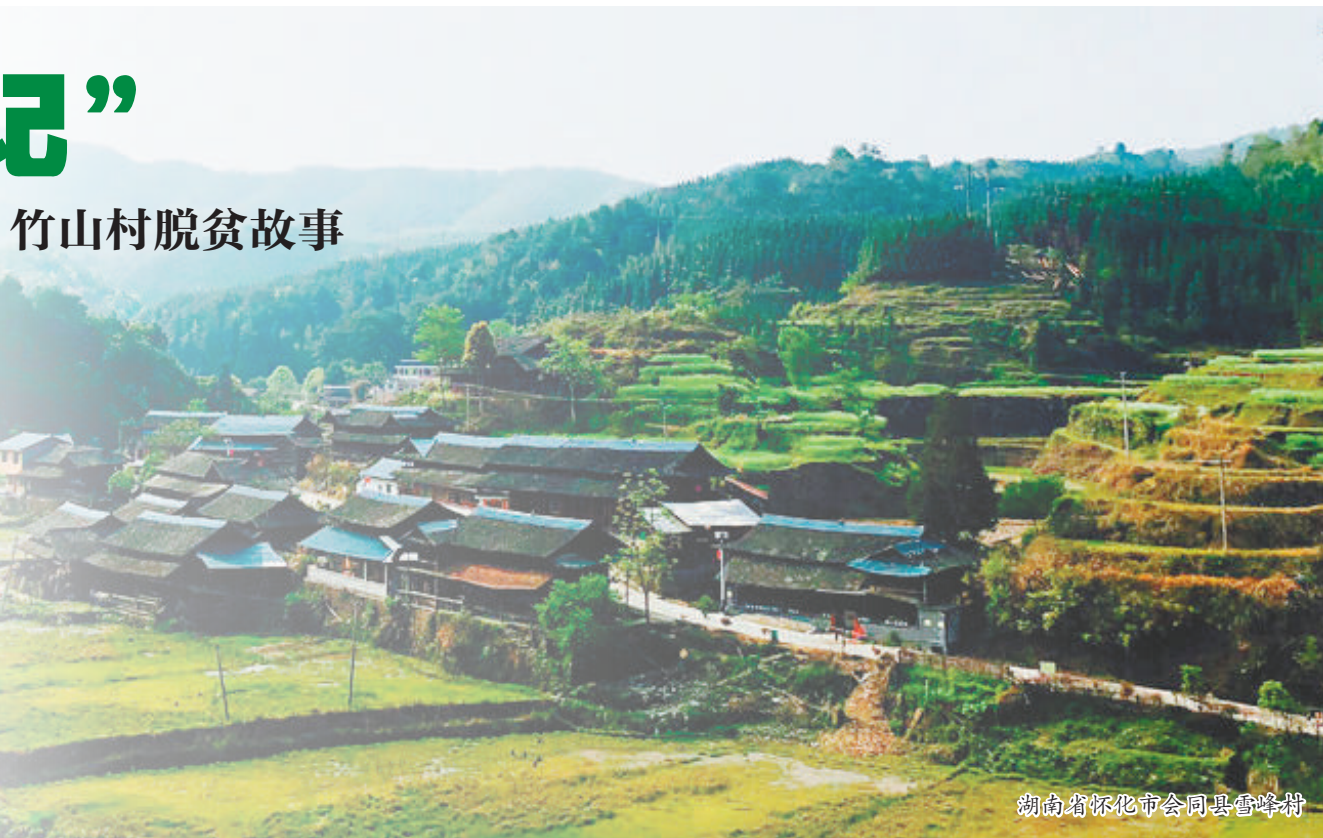
湖南省怀化市会同县雪峰村

在竹山村，扶贫工作队联合当地党委、政府和相关文化旅游企业，对村民开展培训，以上“夜校”、看电影和调研走访等方式，引导群众转变思想观念。竹山村迅速建成了游客服务中心、停车场、旅游厕所等文化旅游基础设施，打造了“竹山乡居”高端民宿、《爱在竹山》沉浸式体验式