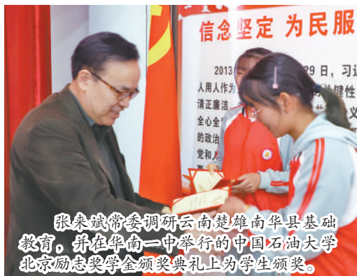
张杰委员调研云南楚雄南华县基础教育，并在南华一中举行的中国石油大学北京励志奖学金颁奖典礼上为学生颁奖。