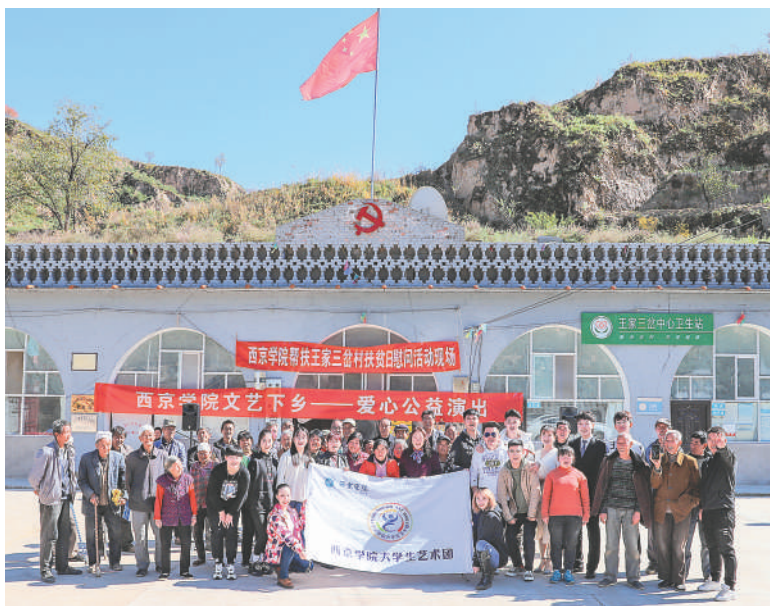
西京学院组织师生赴贫困地区进行爱心公益演出

脱贫，但是处于边缘的低收入人群和部分家庭因病致贫的风险依然存在，党中央十分关注这一问题，习近平总书记在大会上特别提出“脱贫摘帽不是终点，而是新生活、新奋斗的起点”，这就是向全国人民发出的新的动员令。事实证明，教育是阻断贫困代际传递的最有效途径。作为民办教育工作者，我们要继续立足本职工作，发挥教育在就业进程中、家庭致富方面的特殊作用，充分用好民办学校体制机制优势，在巩固脱贫成果、建立防范返贫长效机制、助力乡村振兴方面下功夫，为在全面建成小康社会基础上实现国家全面现代化作出更新更大的贡献。