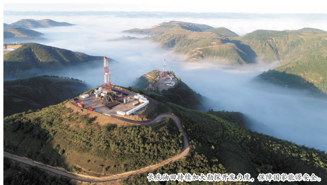
长庆油田持续加大勘探开发力度,保障国家能源安全。

作为“三低”油气田,长庆油田的显著特点是“井井有油,井井不流”,并不压裂不出油,储层不注水没产能。从上世纪80年代初,长庆油田在陕北革命老区安塞谭家营打下的第一口探井,到上世纪90年代安塞油田投