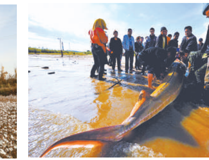
黑龙江佳木斯市产业化龙头企业渔业扶贫贷款项目