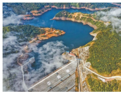
福建泉州市德化县彭村水库工程项目

5969亿元,其中在雄安新区投放46亿元。加大对粤港澳大湾区、海南自由贸易港等国家重点战略支持力度,有效发挥了战略支撑作用。