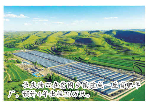
长庆油田在贫困乡镇建成一座育肥羊厂,预计4年出栏20万只。