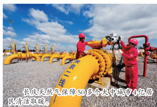
长庆天然气保障50多个大中城市4亿居民清洁能源。