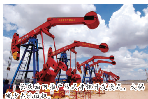
长庆油田推广丛式井组开发模式,大幅减少占地面积。