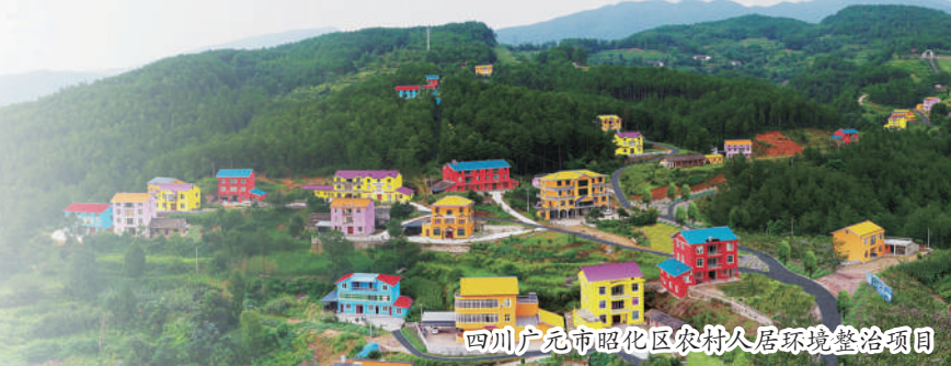
四川广元市昭化区农村人居环境整治项目

“十三五”时期是全面建成小康社会的决胜阶段。农发行坚持以习近平新时代中国特色社会主义思想为指导,认真贯彻落实党中央、国务院方针政策和决策部署,坚守初心、勇担使命,全力服务国家战略和“三农”发展,充分发挥“当先、补短板、逆周期”职能作用,为决战决胜脱贫攻坚、全面建成小康社会作出积极贡献。5年来累计投放支农资金9.6万亿元,其中各类贷款8.93万亿元,期末贷款余额6.14万亿元,较2016年初净增2.7万亿元,年均增长12.27%,是农发行历史上支农力度最大、发挥作用最突出的时期。