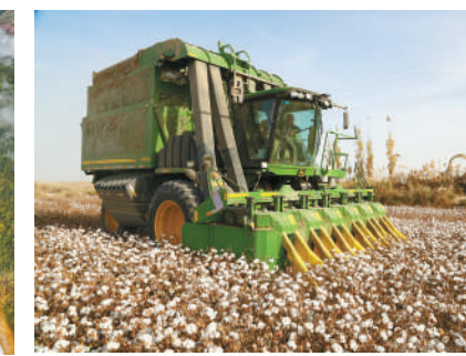
新疆阿克苏沙雅县农村基本农田流转项目