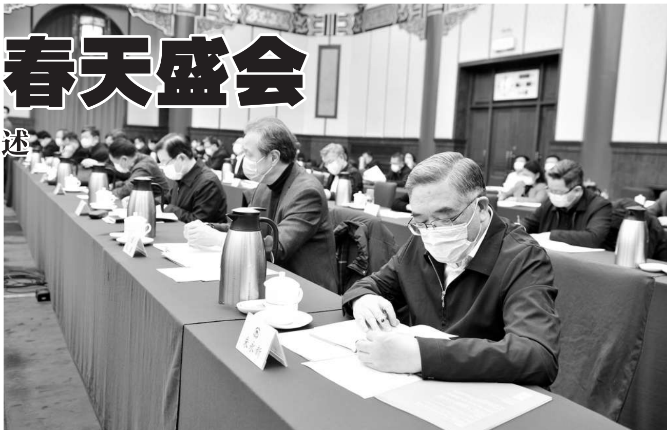
1月14日，全国暨地方政协委员读书经验网上交流会在北京举行。图为会议现场。