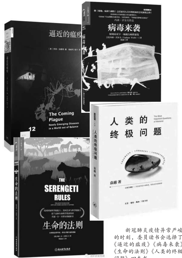
新冠肺炎疫情异常严峻的时刻，委员读书会选择了《逼近的瘟疫》《病毒来袭》《生命的法则》《人类的终极问题》四本书。