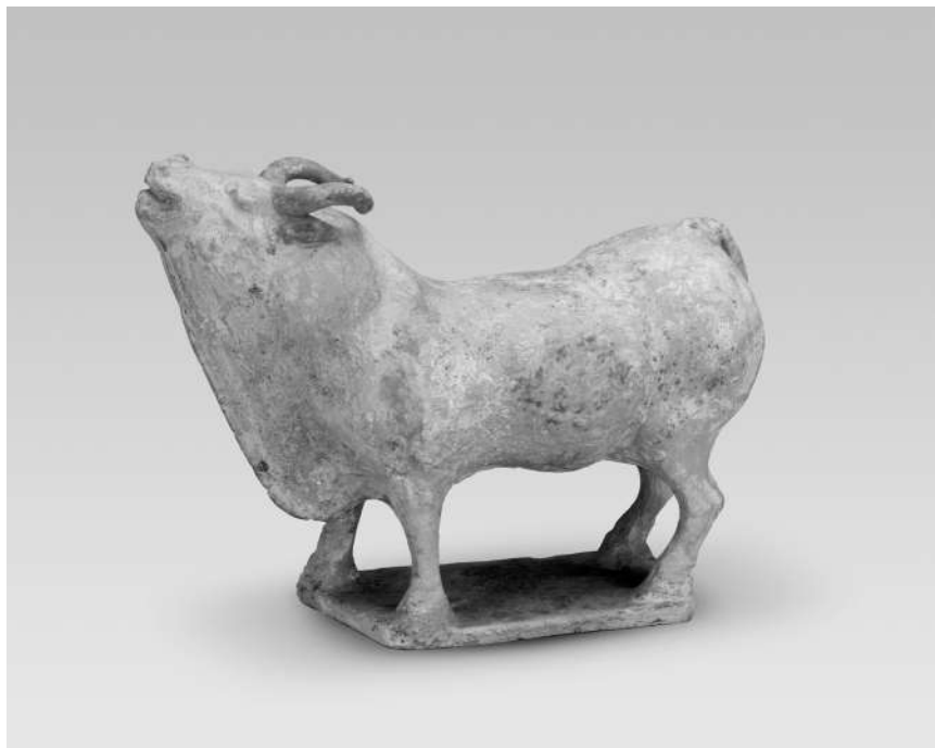
陶牛 中国国家博物馆藏

春回大地，万象更新。随着牛年的到来，与牛相关的文物成为博物馆里的“新宠”，不仅获得了观众的喜爱和追捧，也成为连接历史与现实的“使者”，讲述着不为人知的文物故事。