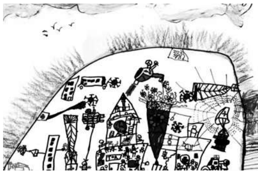
幼儿抗疫创意画:可以变大变小的“城市病毒防护罩”,哪儿有病毒就把哪儿罩住,再把病毒消灭光。体现了分级分类管理疫情的思想。

美国教育心理学家乔纳森在《学会解决问题》一书中强调:“教育唯一真正的目标就是解决问题”。每天早晨,当我们一觉醒来时,就会遇到各种各样的学习、生活和工作中问题需要解决;一个呱呱坠地的婴儿,在完成社会化的过程中,同样会遇到各种各样的成长的烦恼。成为一个创造性的“问题解决者”,是迎接无法准备的未来挑战的最可靠的途径。巧思法是一种创造性最优问题解决方法论,倡导儿童关注并直接参与社会生活,探索问题解决,培养儿童拥有创造性问题解决能力,符合时代精神和未来需要。