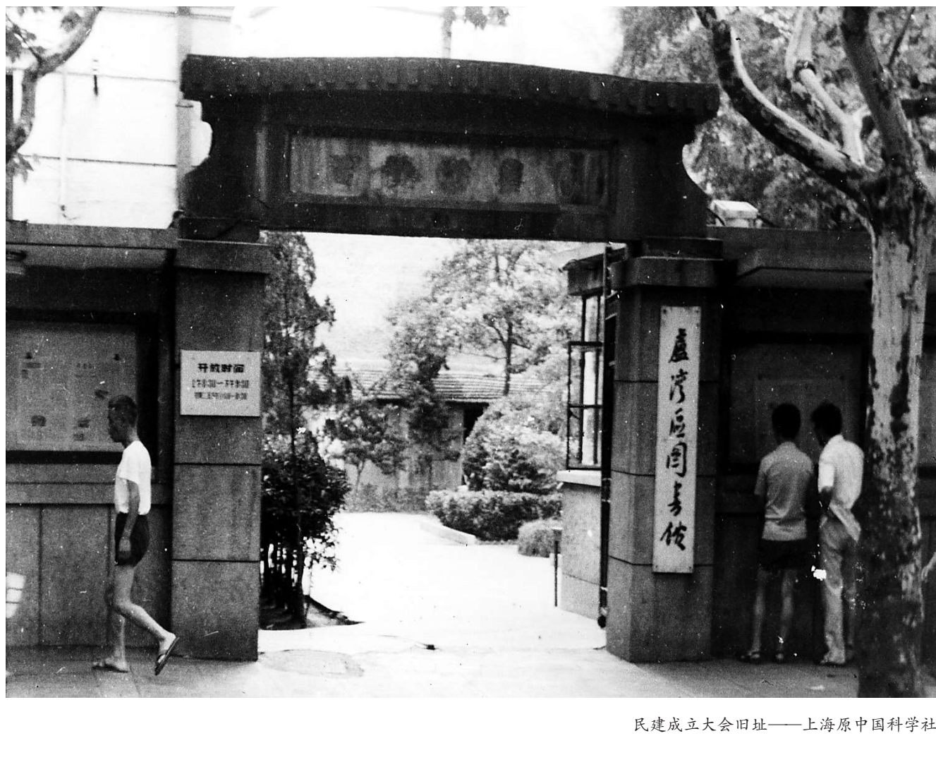
民进成立大会旧址——上海原中国科学社

本文所记述的，就是民进中央成立旧址的确认与修复的过程。在中国共产党建党100周年之际阅读此文，我们从中可以感受到两党风雨同舟、团结合作的历史进程。