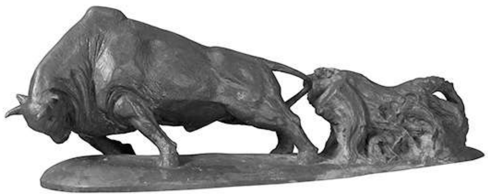
潘鹤《开荒牛》 雕塑 中国美术馆藏

新春将至,年味渐浓。2021年春节,为响应居家过年、就地过年的号召,各地博物馆、美术馆、图书馆纷纷推出内容多元、形式多样的春节特色展览,让观众可以在春节期间感受浓浓年味,体会传统年俗的文化内涵。