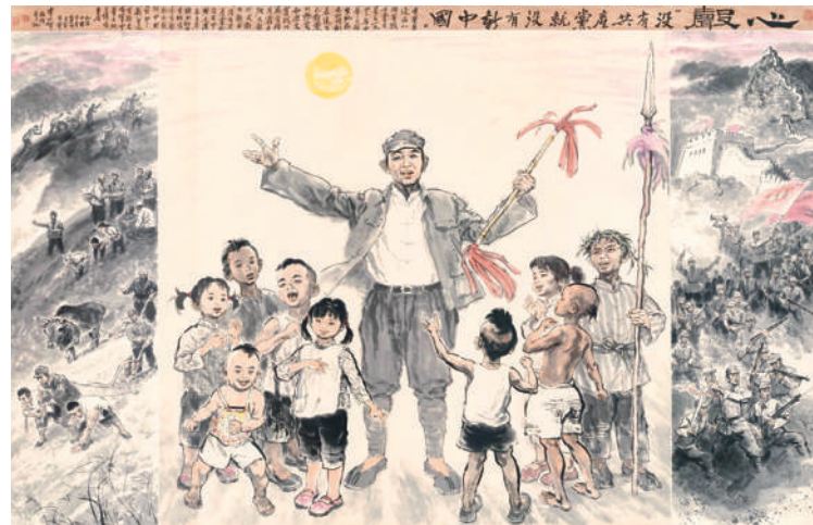
▲《心声——没有共产党就没有新中国》 李廷声 作