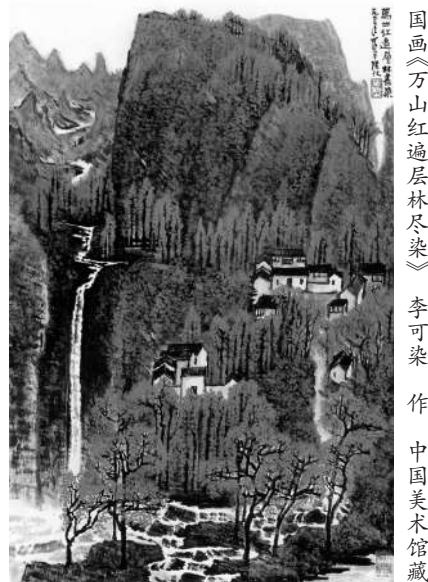
国画《万山红遍层林尽染》 李可染 作 中国美术馆藏

长征之路艰苦卓绝，长征诗词光耀人寰。毛泽东在长征时期创作的8首诗词，生动反映了红军辗转曲折的平仄行迹，艺术再现了长征从困苦走向胜利的光辉图景。不啻“雄关漫道真如铁”，又何来“三军过后尽开颜”？这8首诗词分别是：《清平乐·会昌》《忆秦娥·娄山关》《十六字令三首》《七律·长征》《念奴娇·昆仑》《清平乐·六盘山》。