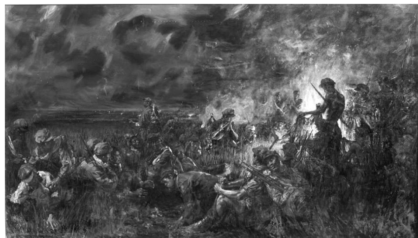
油画《红军不怕远征难》董希文 作 中国人民革命军事博物馆藏

毛泽东直言：“万里长征，千回百折，顺利少于困难不知有多少倍。”然而，“红军不怕远征难，万水千山只等闲”“山高路远坑深，大军纵横驰奔”。纵然“路隘林深苔滑”，革命队伍依然“直指武夷山下”。“头上高山，风卷红旗过大关”“不到长城非好汉”。别谈娄山关“一夫当关，万夫莫开”，“雄关漫道真如铁，而今迈步从头越”。“离天三尺三”的山再高，英勇红军“快马加鞭未下鞍”，而“五岭逶迤腾细浪，乌蒙磅礴