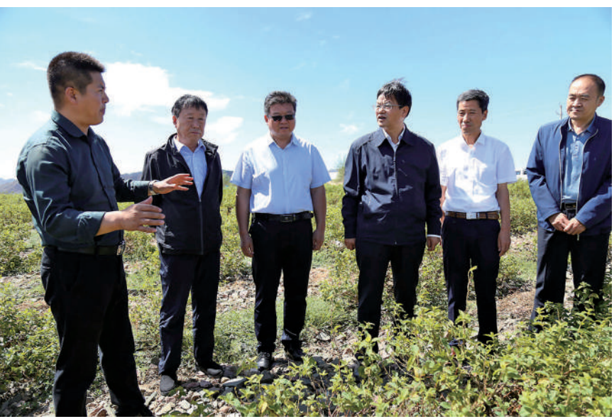
中卫市政协就委员提出的“把金银花种植作为增加农民收入、助力脱贫攻坚的重点产业予以扶持”开展专题调研，图为调研现场。

如何发挥人民政协作为专门协商机构的重要作用，需要深刻理解人民政协的内在运行机理，从而更好地将人民政协的制度优势转化为治理效能。2020年，中卫市政协开拓进取，进一步发挥了