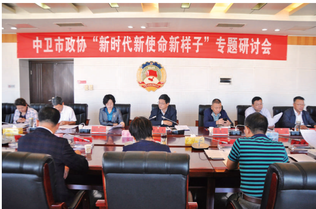
中卫市政协召开“新时代新使命新样子”专题研讨会

奋进新时代，中央和区市党委对政协工作的部署要求是否落实到位？担当新使命，如何更好发挥人民政协的优势和作用？干出新样子，还有哪些能力短板亟待补齐，又有哪些经验做法值得学习借鉴？2020年，宁夏回族自治区中卫市政协以“新时代新使命新样子”（下称“三新”）学习讨论活动为抓手，落实中央政协工作会议精神，有力推动了政协工作提质增效。